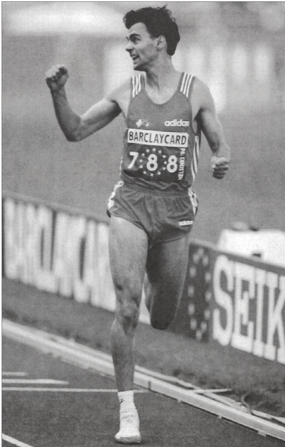
Helsinki, Championnats d'Europe 1994: médaille de bronze.