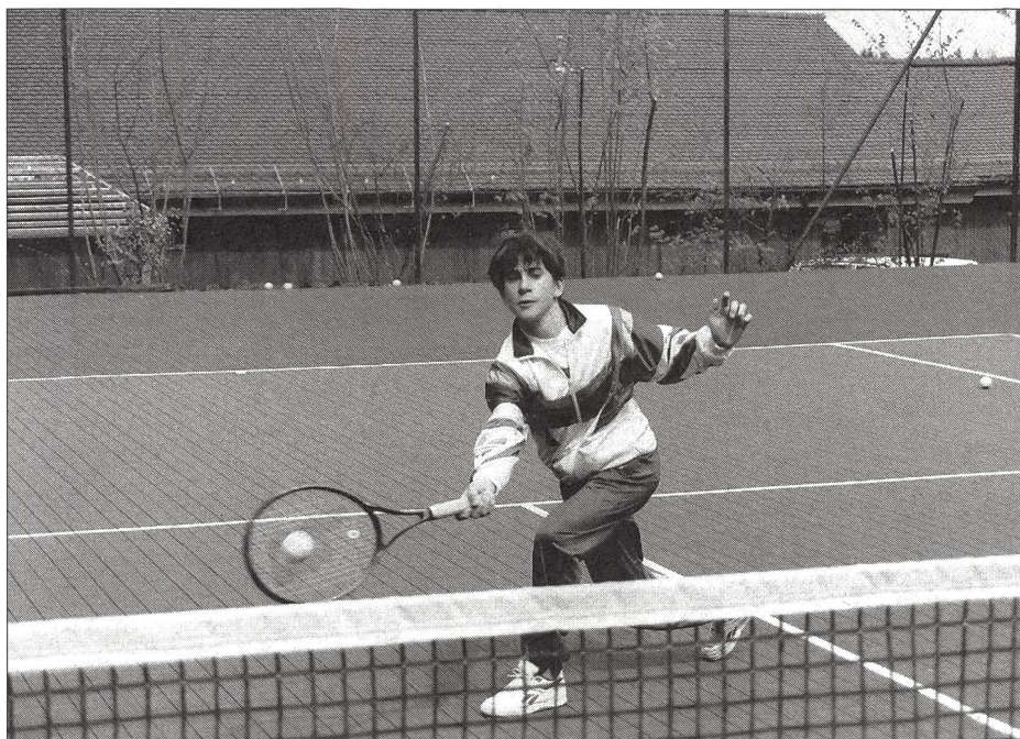
Les surfaces synthétiques ou en dur conviennent particulièrement bien aux joueurs d'attaque. Sur ce type de surfaces, les articulations du joueur sont plus sollicitées que lorsqu'il évolue sur la terre battue.

pellation de «terrains stabilisés mécaniquement». Il s'agit de la surface la plus répandue en Europe, malgré les problèmes et l'ampleur de l'entretien qu'elle suppose. Il existe plusieurs variétés de terre battue: la plus courante en Suisse et en France est à base de calcaire, la plus courante en Allemagne, en Autriche et en Italie à base de schiste rouge. Une terre battue moins gélive, constituée de sable de roche de couleur verte a, elle aussi, fait ses preuves.