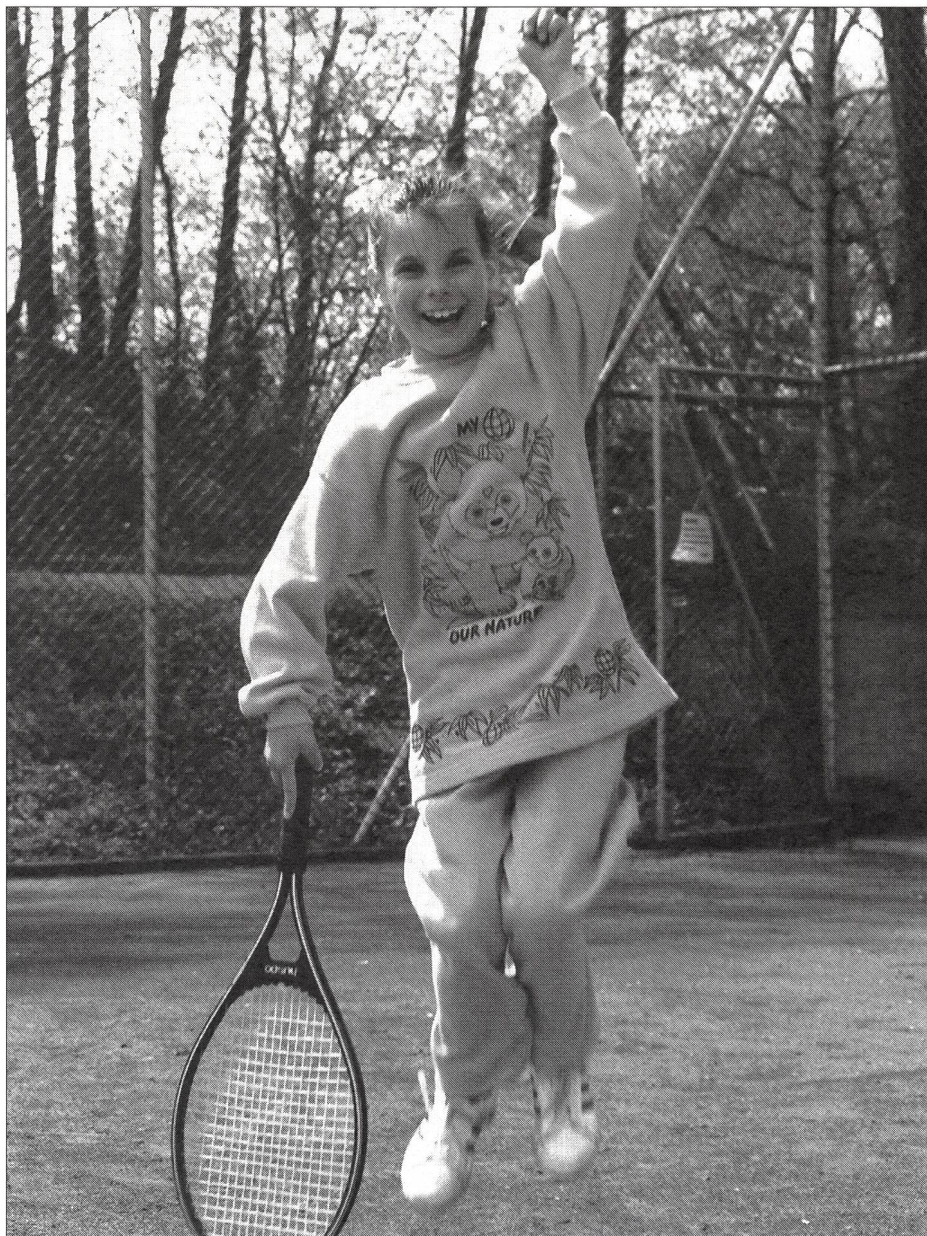
Championne, elle jouera peut-être sur la surface miracle répondant aux nombreuses exigences du tennis!

Il n'existe pratiquement pas de littérature sur les revêtements de sol des installations de tennis si ce n'est sur la technique de la construction. Les joueurs sont pourtant les premiers concernés puisqu'il en va de la qualité du jeu et de leur santé. C'est ce qui a décidé l'auteur d'approfondir le sujet. Il s'est essentiellement basé sur ses expériences et observations personnelles faites au cours de nombreuses années de pratique en tant que joueur, entraîneur diplômé du CNSE et architecte spécialisé dans la construction d'installations sportives. (Ny)