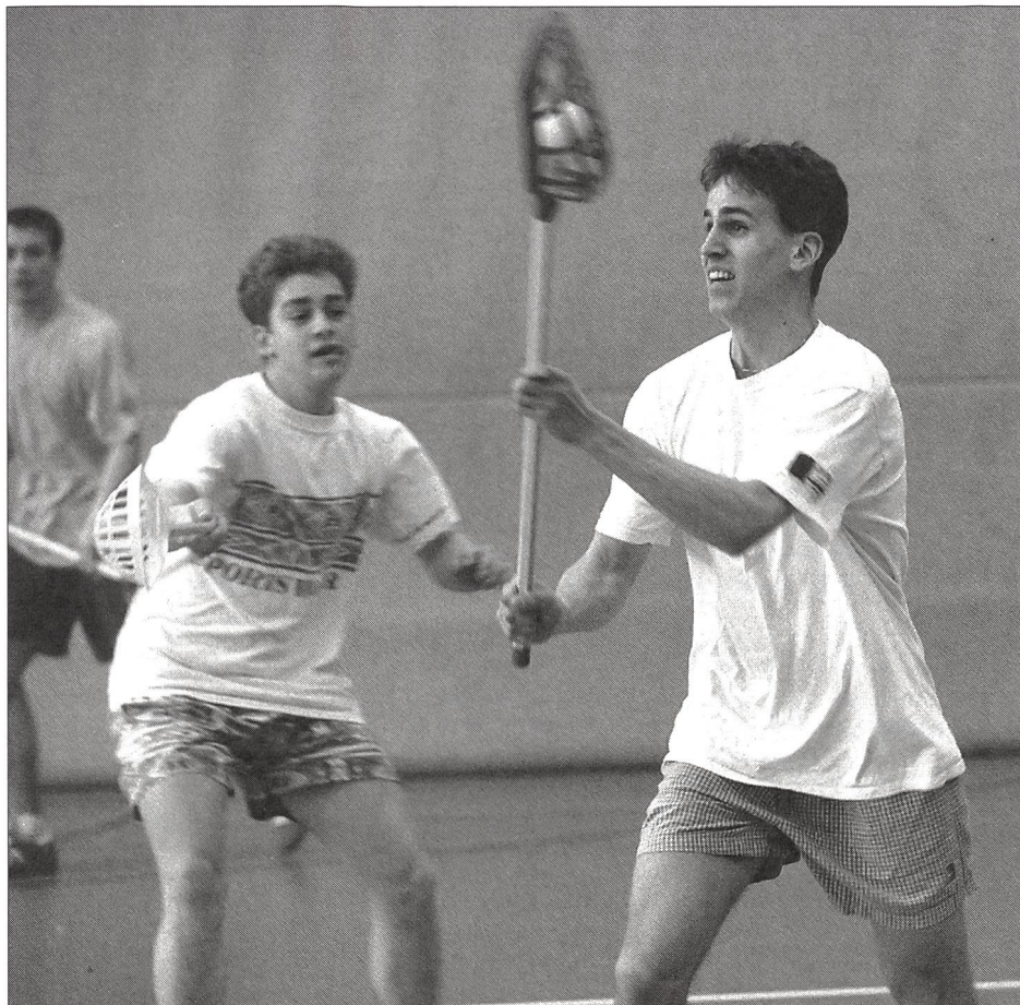
Passe et défense, crosse levée.

est sanctionné par un coup franc pour l'équipe adverse.