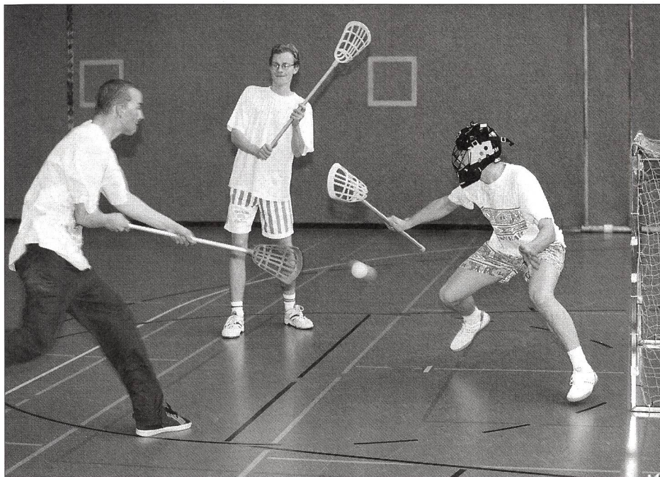
Tir au but: après un tir ou une passe, la crosse indique la direction du but.

Rolf C. Jakob, président de la Fédération suisse de lacrosse et d'inter-crosse Traduction: Dominique Müller