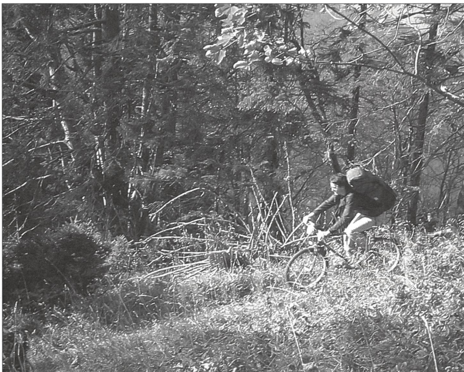
En route vers le campement.

Le but de cette excursion est de trouver un endroit en lisière de forêt ou dans une