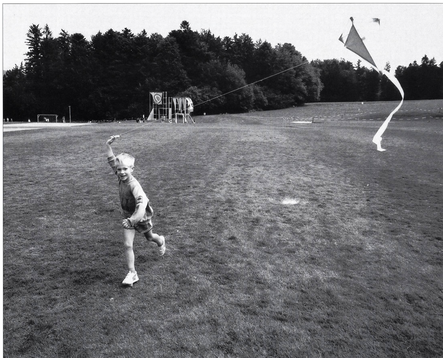
Laisser du temps à l'enfant... (Voir article pp. 14 à 17.)