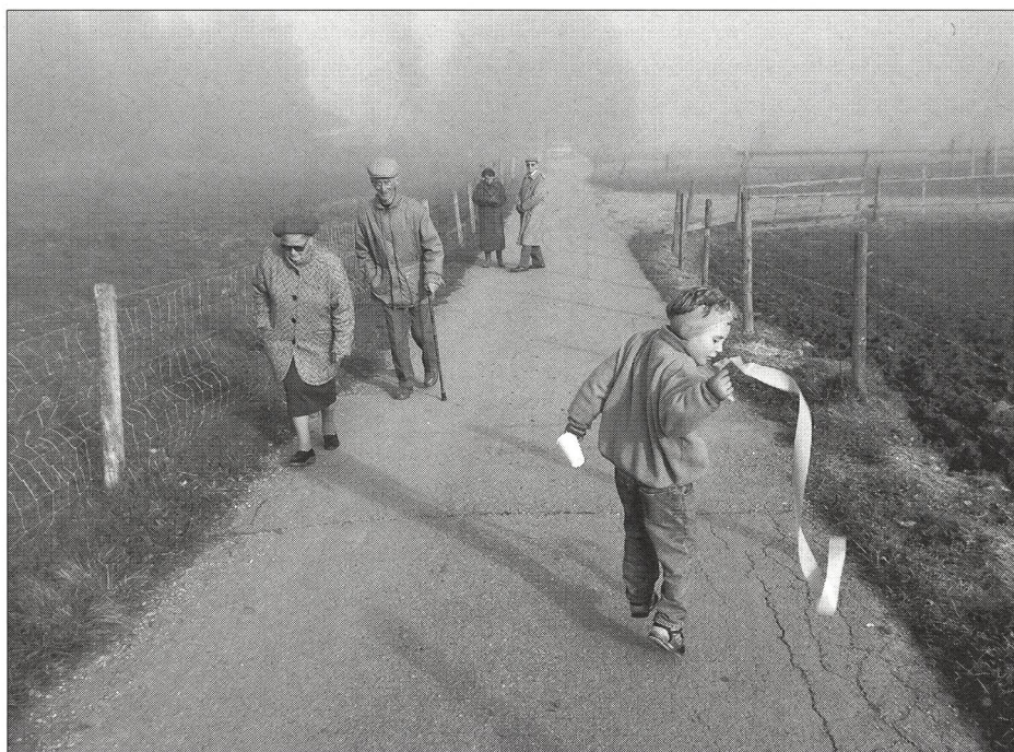
L'enfant, un être en devenir.

L'impatience de l'adulte a souvent pour effet d'éteindre prématurément la petite flamme du progrès qui brûle à l'intérieur de chaque jeune. Souvent il m'est arrivé à moi-même d'éliminer, en pensée, de jeunes nageurs/nageuses de la liste des vainqueurs en puissance, de la