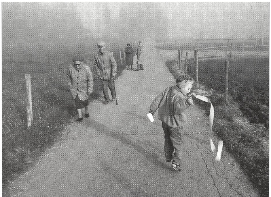
L'enfant, un être en devenir.

L'impatience de l'adulte a souvent pour effet d'éteindre prématurément la petite flamme du progrès qui brûle à l'intérieur de chaque jeune. Souvent il m'est arrivé à moi-même d'éliminer, en pensée, de jeunes nageurs/nageuses de la liste des vainqueurs en puissance, de la