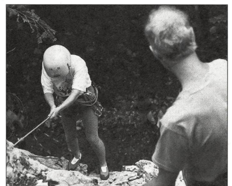
Le conseiller a choisi d'endosser des responsabilités pédagogiques.