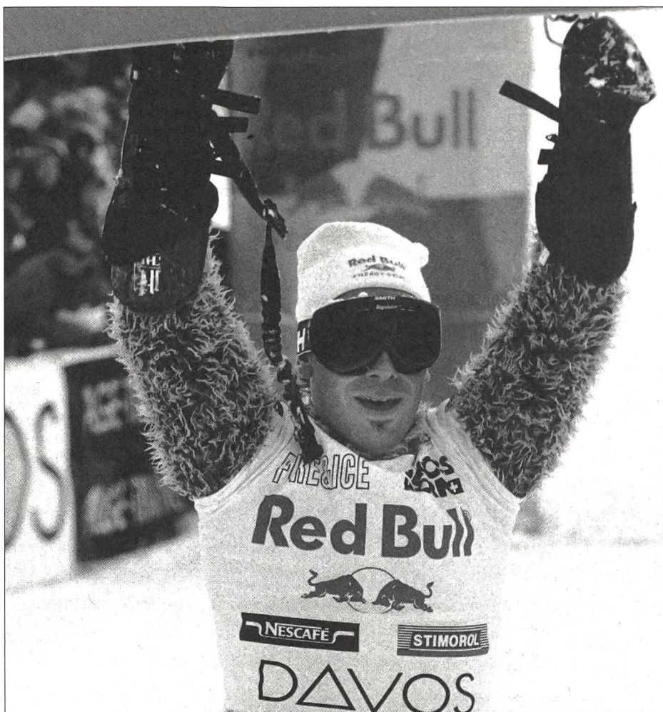
Martin Freinademetz (A), champion du monde aux slaloms géant et parallèle.

Q ui se cache derrière le «sauvage» fonçant sur sa planche? L'amat- teur de techno à l'allure débraillée qui, sous l'effet de l'alcool, de la nicotine, d'une boisson autrichienne ou de l'«Ex- tasy» s'éclate dans les discos? L'ennemi juré du skieur bien élevé, agressif et ef- fronté, la casquette à l'envers et affublé d'un pantalon trop large? Un inconscient cherchant à concurrencer des athlètes sérieux? Un sportif? Un mélange de tout cela peut-être?