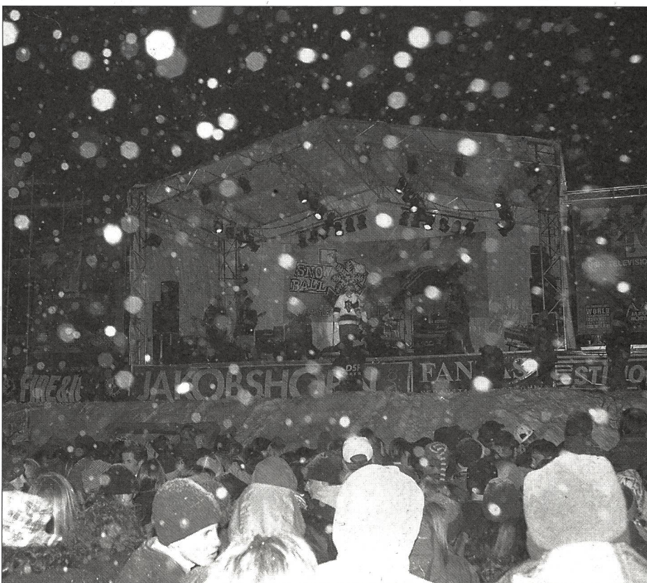
Hip-hop et snowboard font bon ménage. Le groupe «Dog eat Dog» en concert.