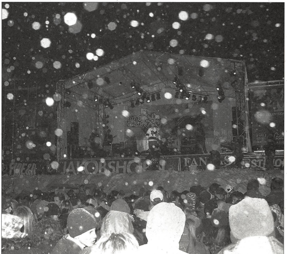
Hip-hop et snowboard font bon ménage. Le groupe «Dog eat Dog» en concert.