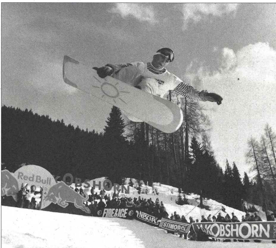
Concentration et élégance en «Pipe».

En dehors du sport, le snowboard est aussi un style de vie dans lequel la liberté a la part belle. Mais le comportement «Just for fun» est-il compatible avec la sanction du contrôle