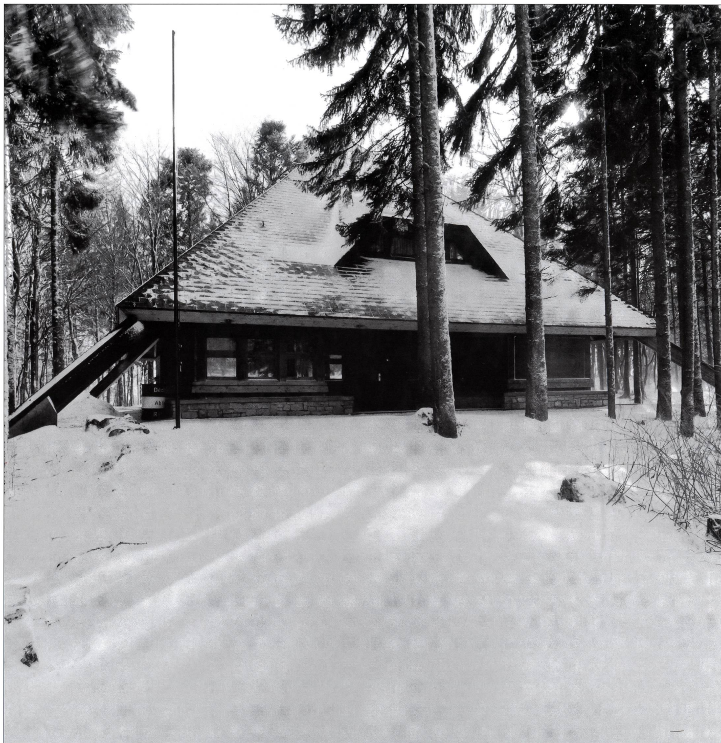
Macolin a aussi sa «Cabane des Bois».