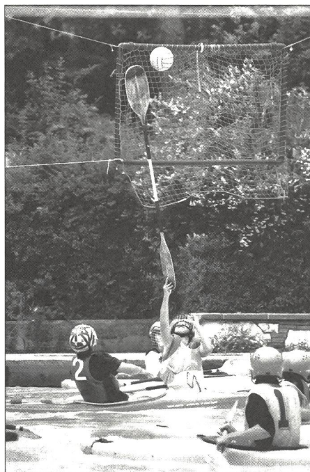
C'est à qui marquera de la plus grande distance.

Fixer un but dans un des coins (une chambre à air de moto gonflée, par exemple). Les enfants sont répartis en deux groupes égaux: les uns lanceront le ballon, les autres le rattraperont. L'équipe qui se trouve en dehors du carré délimité, y lance le ballon. L'autre équipe, qui se déplace à l'intérieur du terrain, cherche à le récupérer le plus rapidement possible pour le jeter dans le but (réussite sanctionnée par un coup de sifflet du moniteur). Pendant ce temps, les membres de l'autre équipe auront tenté de traverser le carré de part en part. Ceux qui n'y seront pas parvenus (leur corps se trouvant encore dans le terrain au moment du