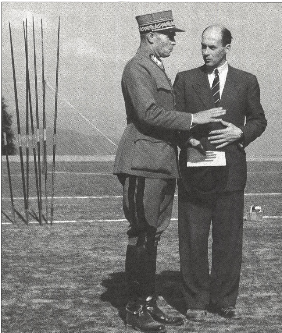
A Macolin, le sport a longtemps été au carrefour des affaires civiles et militaires et ce n'est qu'en 1984 qu'il fut rattaché au DFI (ici: Kaech avec le cdt de corps de Montmollin).

J'étais prêt! A l'entrée du «vénérable» Grand Hôtel, quatre plaques de bronze reluisantes attestaient de la promotion