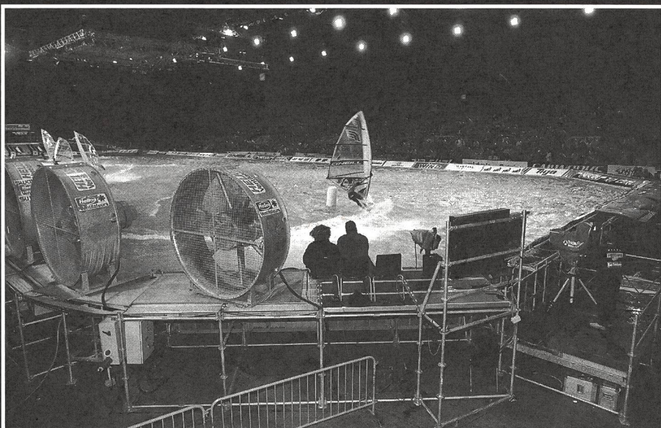
Passage d'une bouée en jibe.