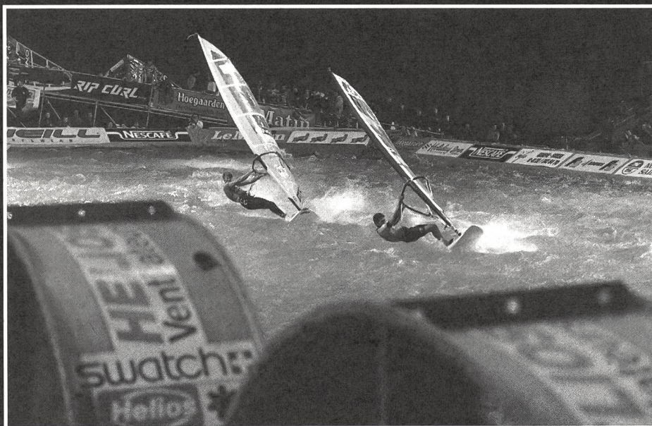
Les ventilateurs, d'une énorme puissance, transforment la piscine en un lac déchaîné.