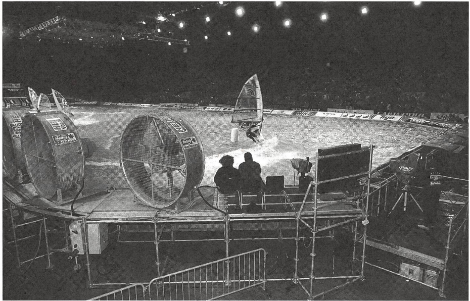
Passage d'une bouée en jibe.