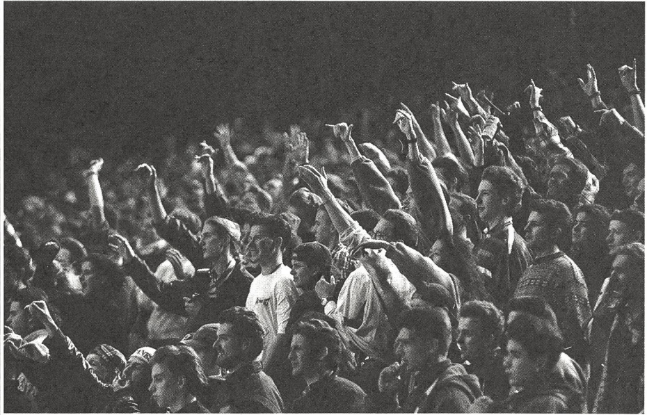
Une telle manifestation a soulevé l'enthousiasme des jeunes «branchés».