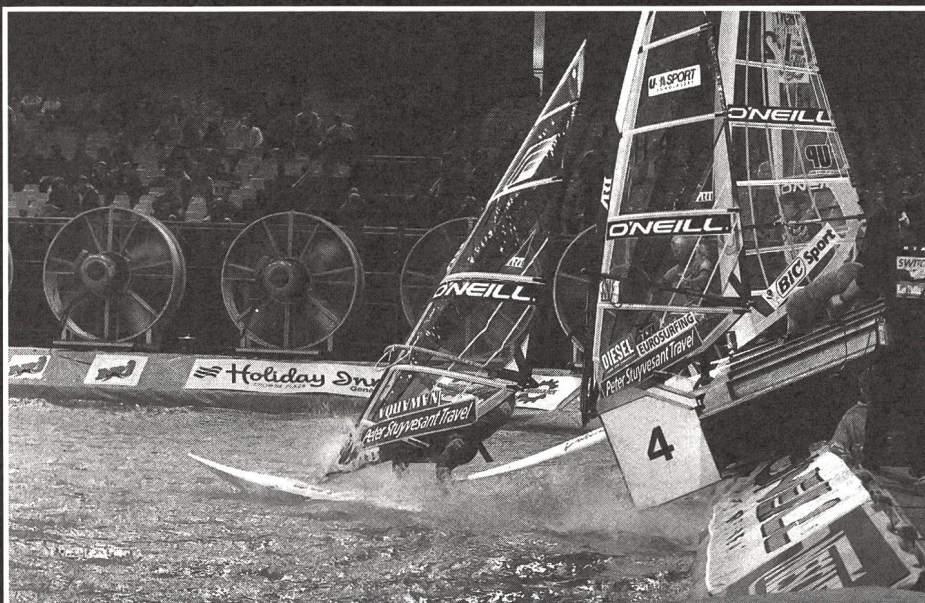
Départ! Les clapets s'ouvrent et les véliplanhistes se laissent glisser sur l'eau.