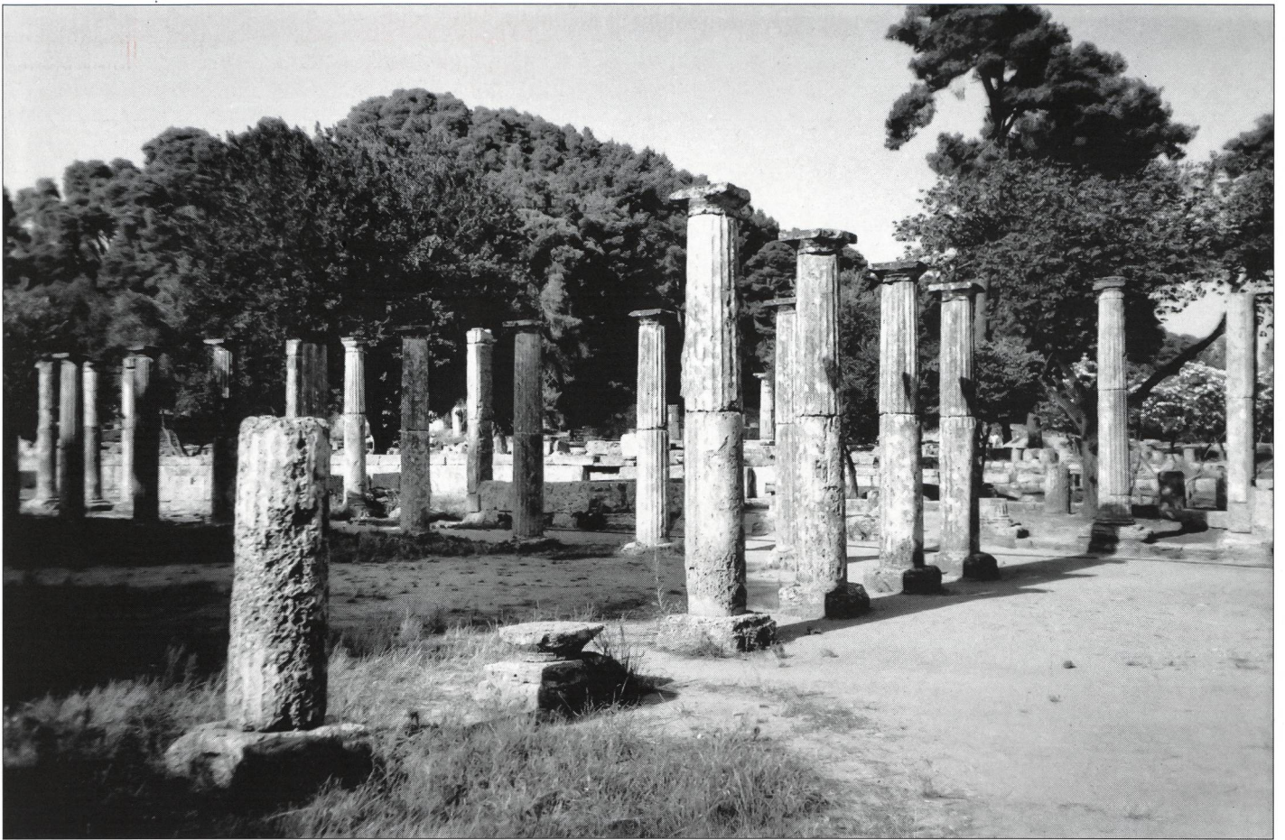
Mémoire olympique vivante (Olympie)...