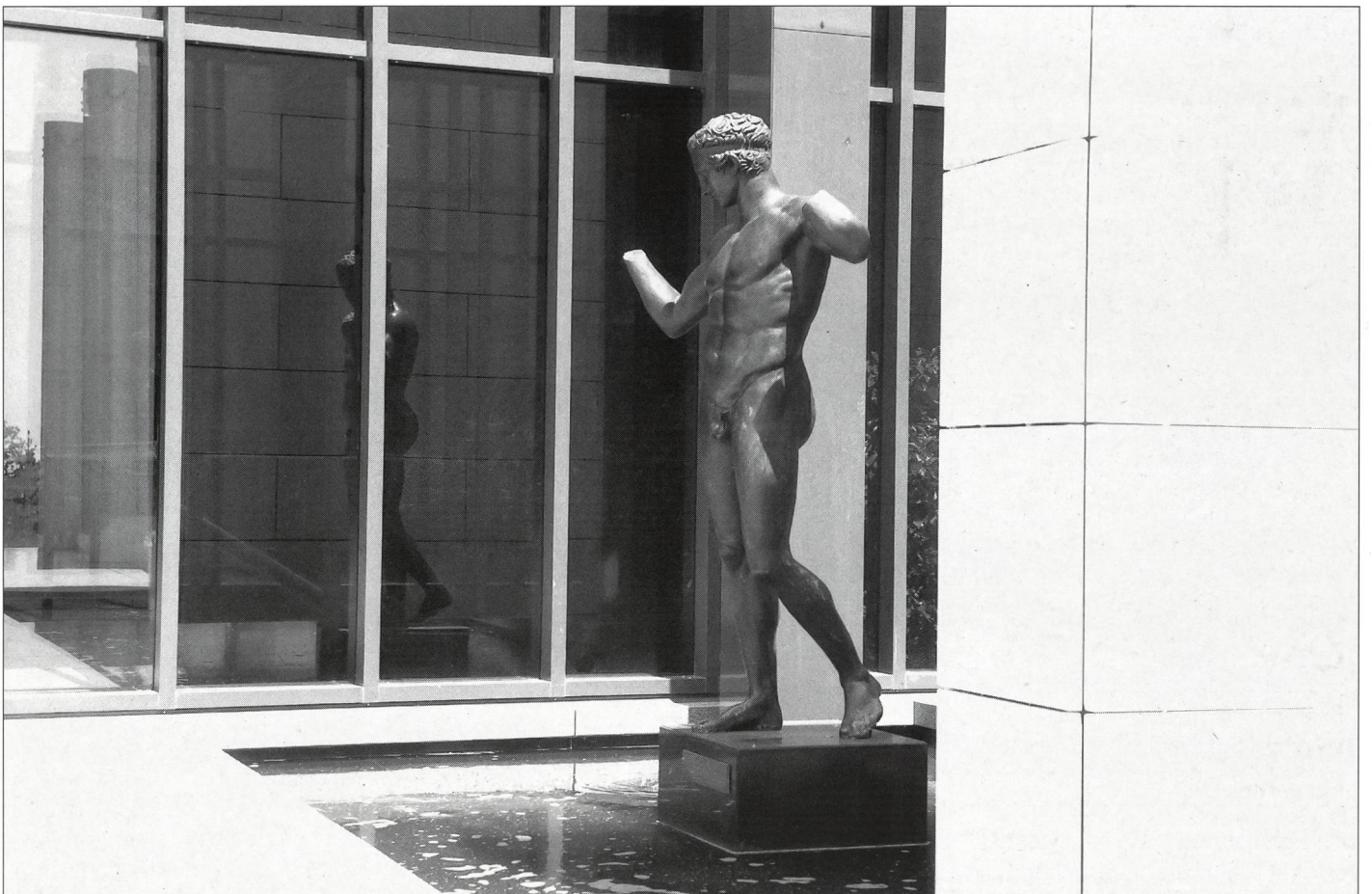
... et muséologique (Lausanne).