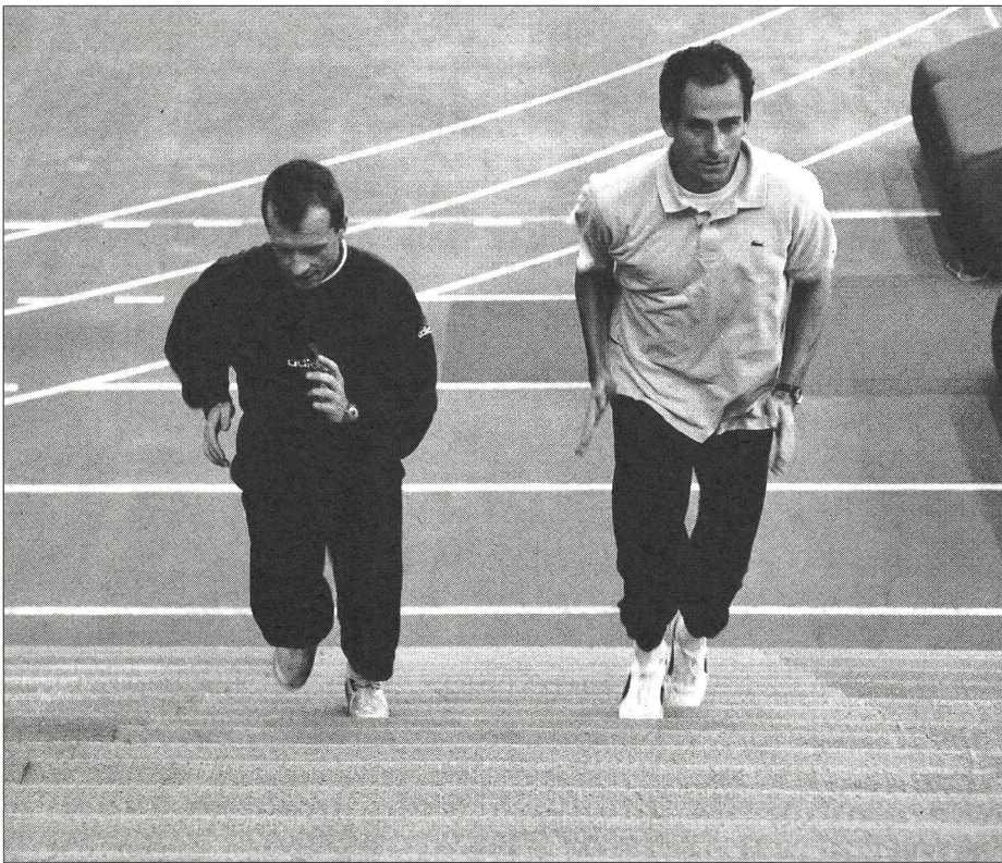
Montée d'escalier sous le contrôle du «physio».