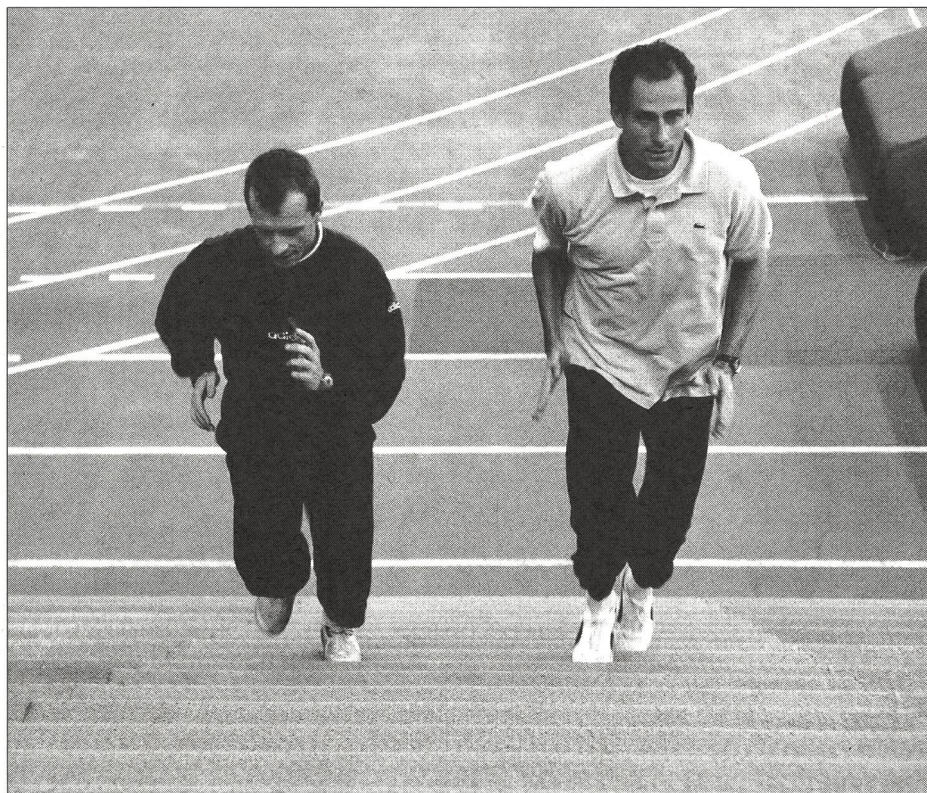
Montée d'escalier sous le contrôle du «physio».