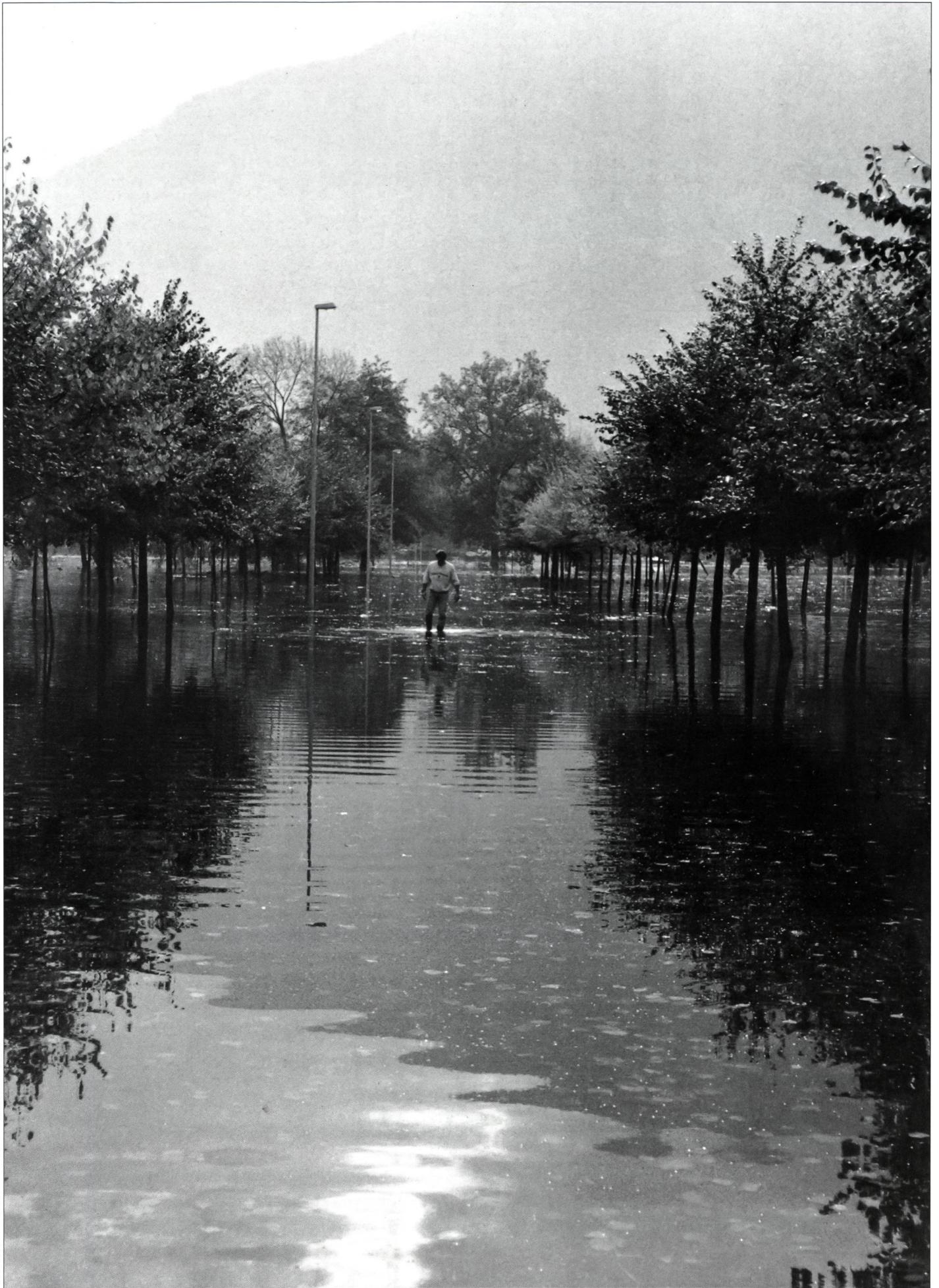
Centre sportif national de la jeunesse de Tenero (CST) sous l'eau... Dur, mais il s'en remettra!