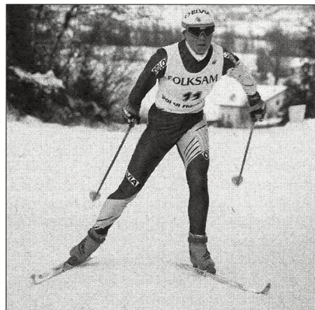
Technique du skating (double poussée des bâtons lors de chaque deuxième poussée de la jambe): on remarque clairement que la skieuse essaie, à partir d'une position du corps relativement verticale, d'amener sa jambe libre loin vers l'avant par une avancée de la hanche.