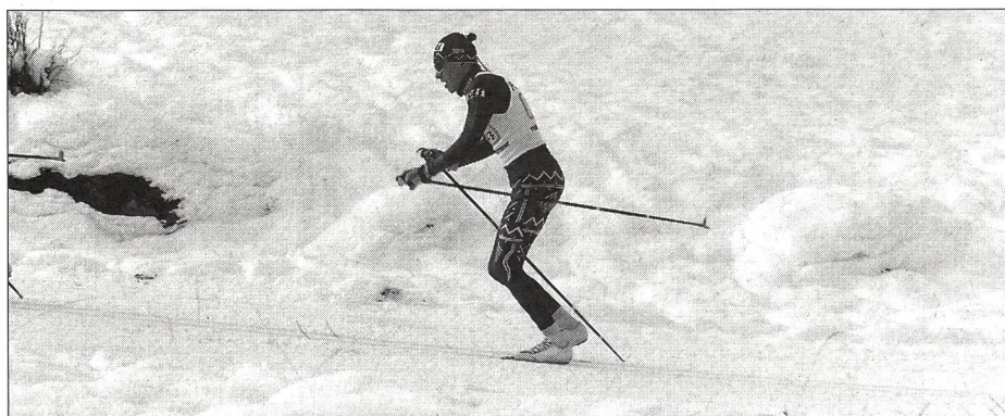
Position de pas alternatif parfaite en montée à pourcentage moyen (démonstration d'un champion du monde norvégien): hanches en avant, corps penché vers l'avant.

Dans l'entraînement de course à pied avec bâtons (marche du skieur et foulées bondissantes) il convient de veiller particulièrement à la position des hanches. Une poussée de jambe effectuée trop loin derrière conduit inévitablement le skieur à «s'asseoir», son centre de gravité étant déplacé vers l'arrière. Il lui faut