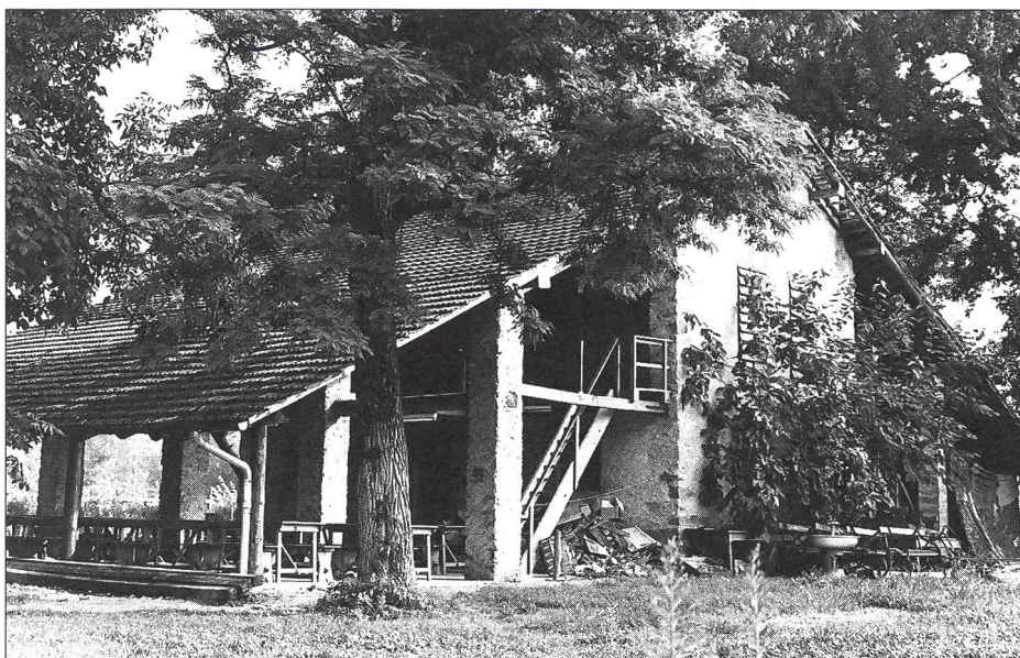
Camping Cascina: la cuisine de campagne.

Quant aux diverses activités communes: repas pris au bâtiment central, vie au