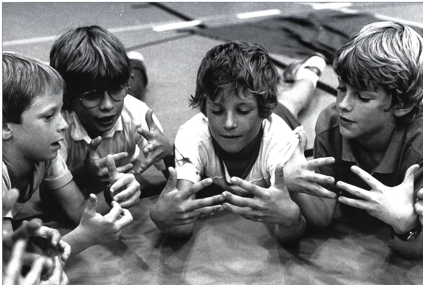
Jeunesse + Sport dès 10 ans? Pour demain peut-être...