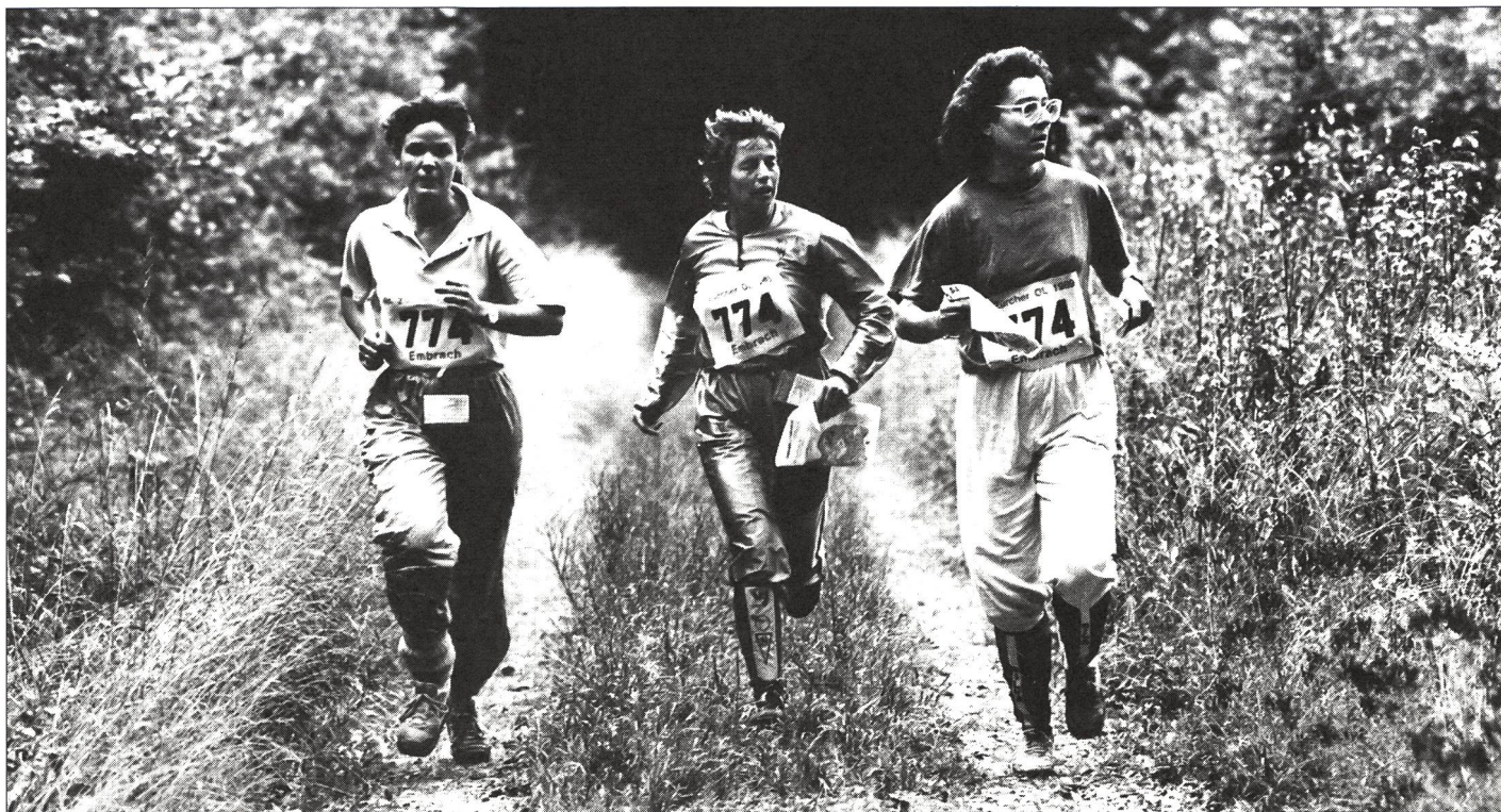
L'habillement constitue une première et excellente protection.

dernière se manifeste de plusieurs façons, comme l'a rappelé Elyes Zhioua: