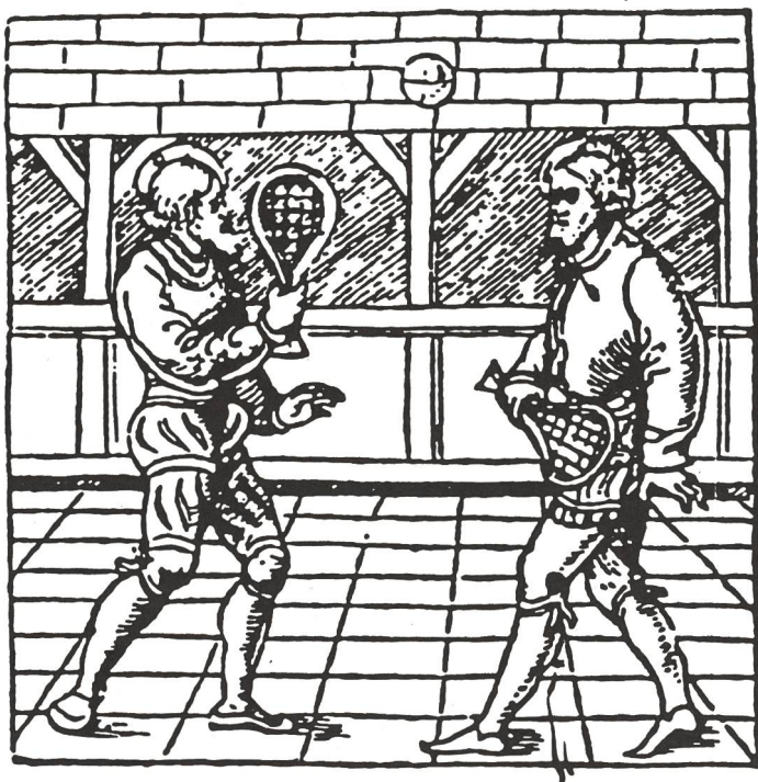
Joueurs de paume.