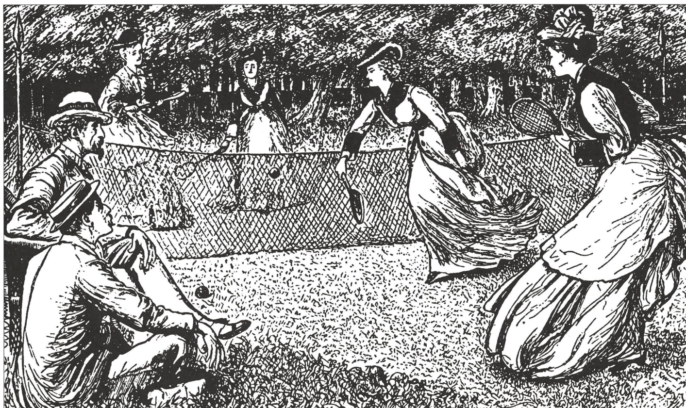
Double dames (1874).

Super qualité (hand made) prix avantageux à partir de 300 pièces déjà Demandez nos prospectus