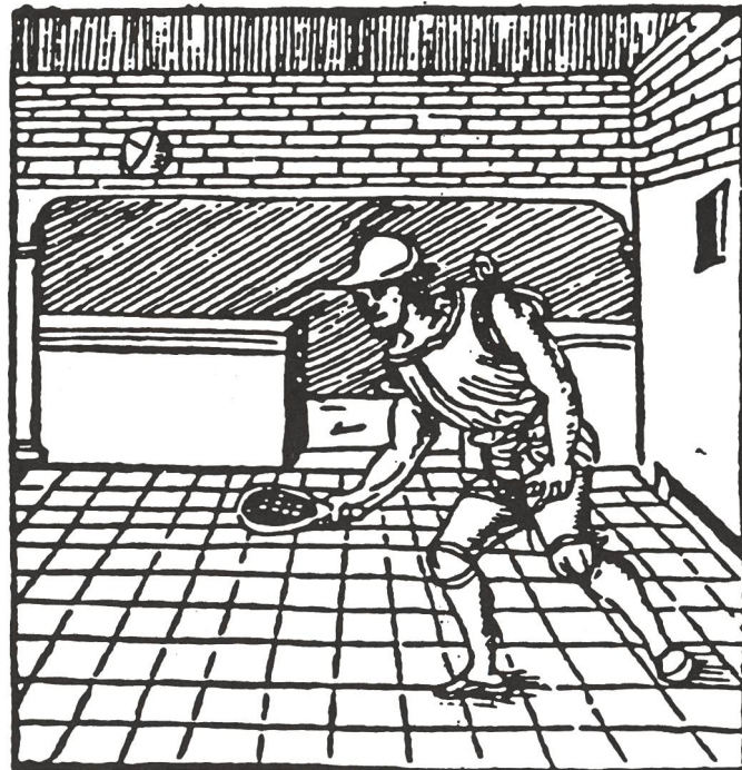
Joueurs de paume.