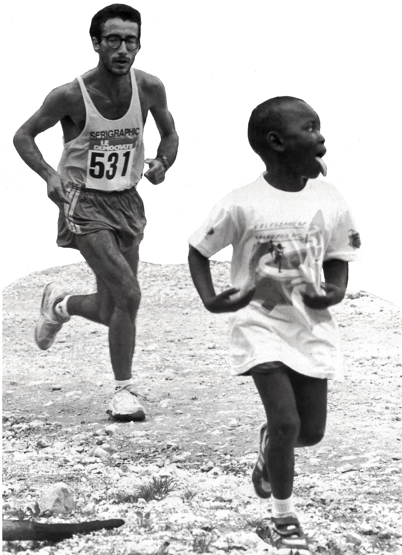
Barcelone, c'est loin encore?...