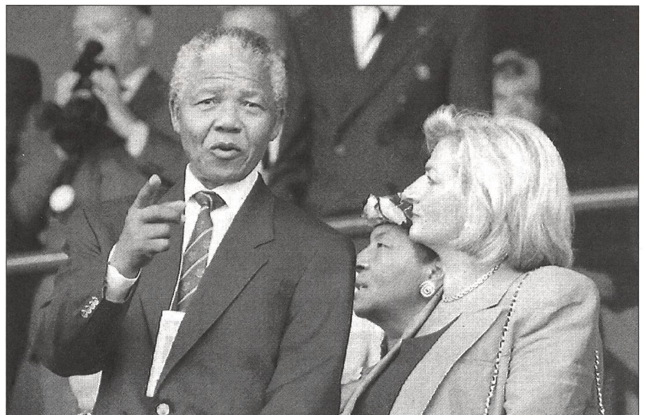
Nelson Mandela fut une des personnalités parmi les plus remarquées lors de la cérémonie d'ouverture: bonjour l'Afrique du Sud!

Un pays qui organise les Jeux olympiques se trouve placé sous les feux de la politique internationale. Les implications d'ordre financier, structurel, médiatique, culturel et ethnique d'une manifestation aussi gigantesque nécessitent l'action de l'Etat. Sans ce dernier, la meilleure des candidatures s'écroulerait comme un château de cartes dès qu'il s'agirait de passer à la réalisation des projets. A l'avenir, il y aura de moins en moins d'Etats – voire d'ensembles d'Etats – capables de relever un tel défi. ■