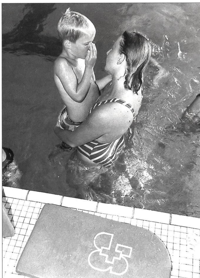
Traditionnelle semaine de natation organisée à l'EFSM.

Revêtements de sol/filets Médecine sportive American Sports Balles/Ballons Gymnastique Natation