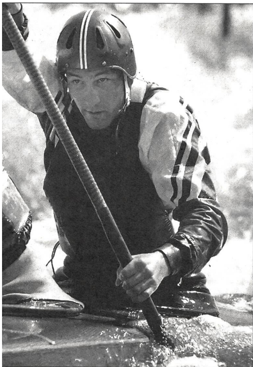
sur le parcours olympique.