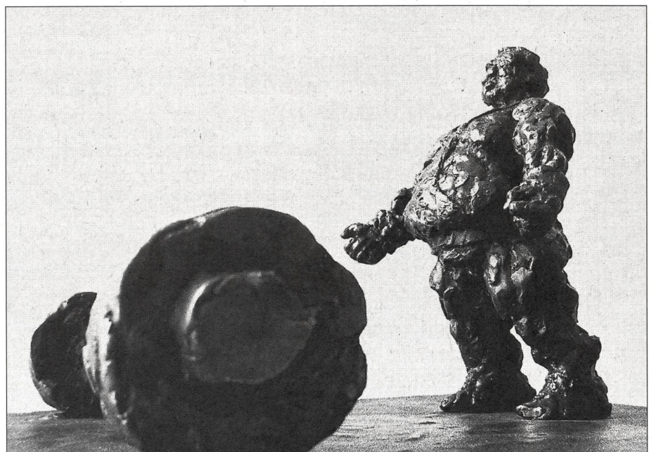
Francis Delivré: «Le défi», bronze.

stein ou Andy Warhol sont surcodées, surritualisées. L'image du joueur de base-ball est simplement différentiée. Aucune valeur ne peut s'y accrocher à la différence de l'expressionnisme ou l'impressionnisme. Il n'y a pas de métalangage, parce qu'il n'y a plus que du métalangage. Ce n'est pas sans rappeler certaines situations où les symboles de la sportivité sont tellement surcodés qu'ils ont perdu tout contact avec leur contexte.