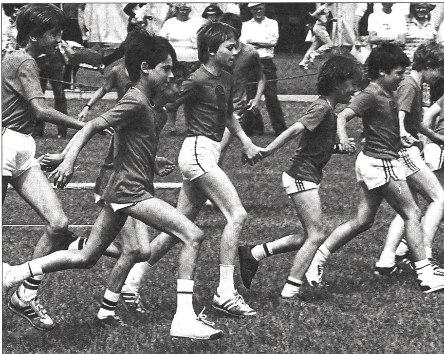
L'avenir de J+S? On y va, main dans la main!

autrement dit la politique, aura un rôle capital à jouer. C'est la raison pour laquelle je vais vous présenter mes thèses politiques relatives au sport de la jeunesse.