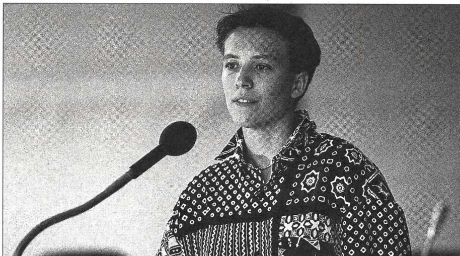
Comment sera la Suisse dans 50 ans?

Dans un tel contexte, défini par des champs de force parfois contradictoires, la boussole, qui continuera à nous montrer les points de repère d'après lesquels nous pourrions nous orienter,