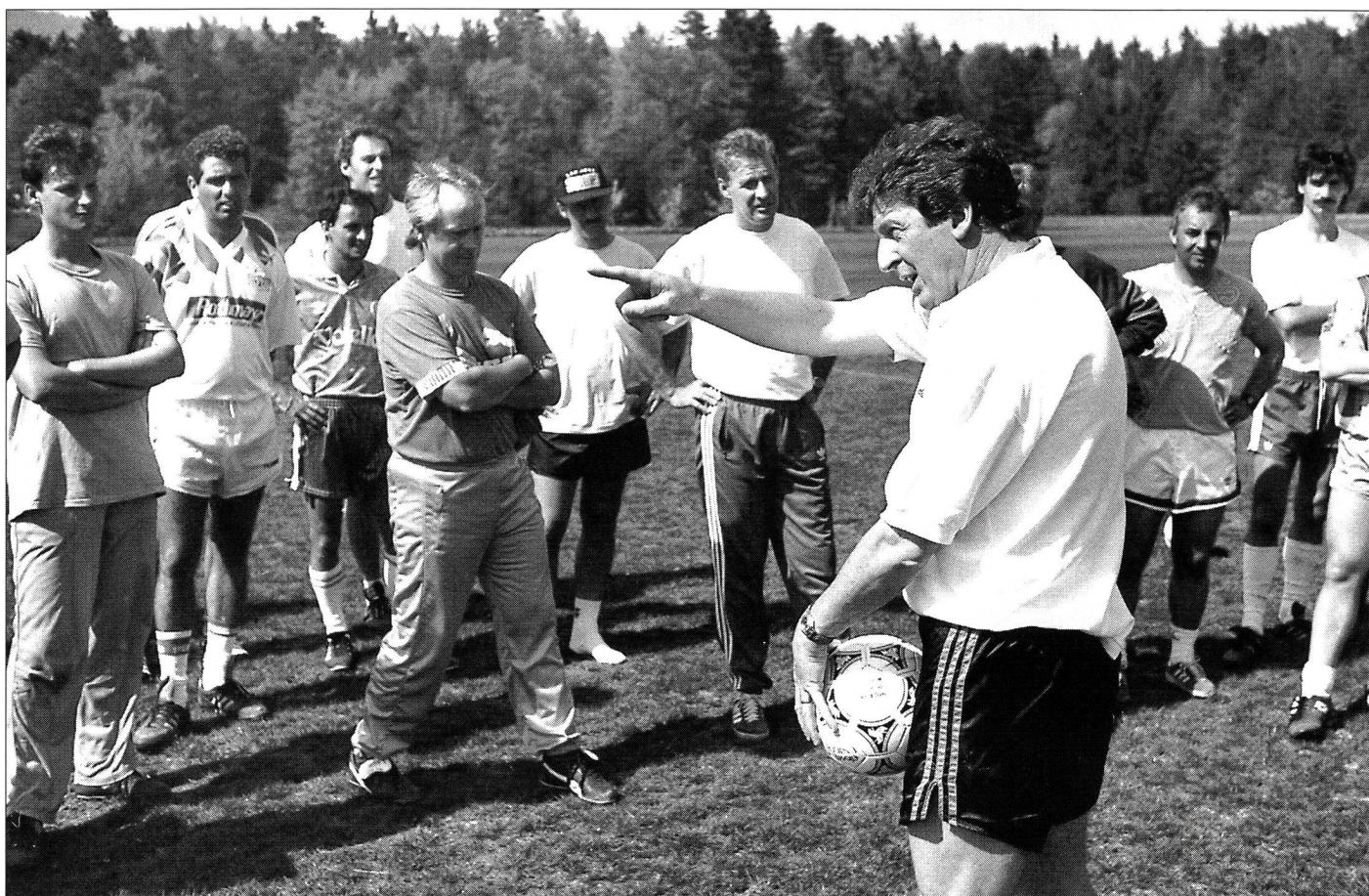
Entraîneur de l'équipe nationale suisse de football, Roy Hodgson est venu à Macolin. Il a accepté avec beaucoup de gentillesse d'y donner une leçon à un groupe de candidats au titre de moniteur 2 J+S...