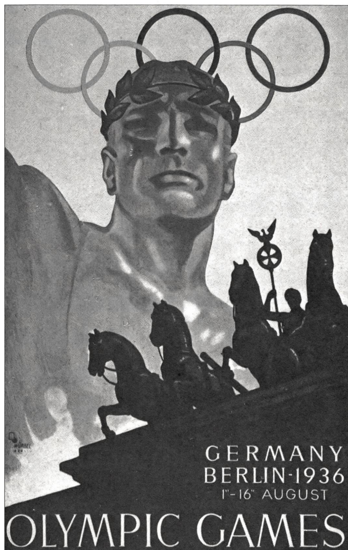
Affiche officielle des Jeux olympiques de Berlin.

socialisme. Dans ces mêmes pays, l'Allemagne et l'Italie, d'autres représentations beaucoup plus idéologiques et aussi moins artistiques sont apparues par la suite en réactivant les figures du sport de l'Antiquité grecque et romaine. La plupart symbolisaient la beauté exemplaire du corps et le courage du héros sportif qui se sacrifiait pour son pays. Il existait, ainsi, toute une imagerie qui, en utilisant les références morales de la Grèce et de la Rome impériale, ont assigné au sport une dimension politique. Il s'agissait de donner une forme picturale ou plastique aux valeurs fondamentales du régime national-socialiste: la force, la violence, le racisme, la famille, la terre... Ainsi, beaucoup d'affiches ou de films, par exemple les «Dieux du stade», de Leni Riefenstahl, se plaçaient dans le contexte d'une culture classique ou antiquisante: chars romains, aigle impérial, corps d'athlète hérité de la statuaire grecque.