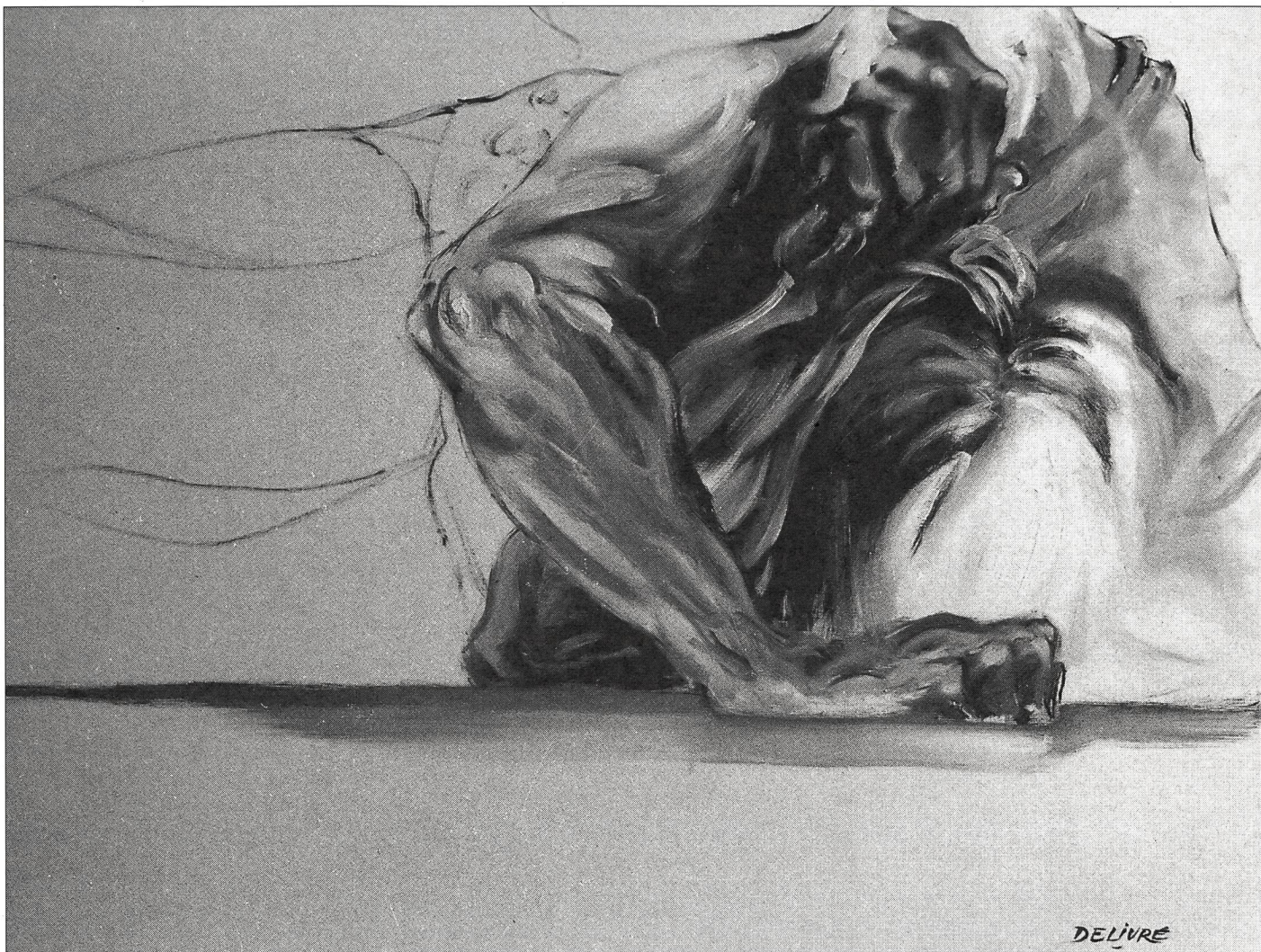
J.-P. Delivré. Peinture: «Fin des espérances».

ser sa condition. Il y a eu, ensuite, toute une esthétique de l'élévation du héros: sportif, ouvrier ou paysan, qui a été développée par divers courants artistiques. Cette célébration du héros sportif au XXe siècle s'inscrit du reste dans les traditions de la culture occidentale, dans la lignée des textes glorieux de l'épopée, de la tragédie, ou des grandes chroniques héritées de l'Antiquité et du Moyen âge. Les institutions sportives ont toujours accordé au corps un rayonnement glorieux, un peu à l'image de ce qui se passe dans la religion avec les saints. Il existe du reste des analogies entre le sport et la religion, entre le sport et la guerre, analogies qui ne seront pas développées dans le cadre de cet article 2 .