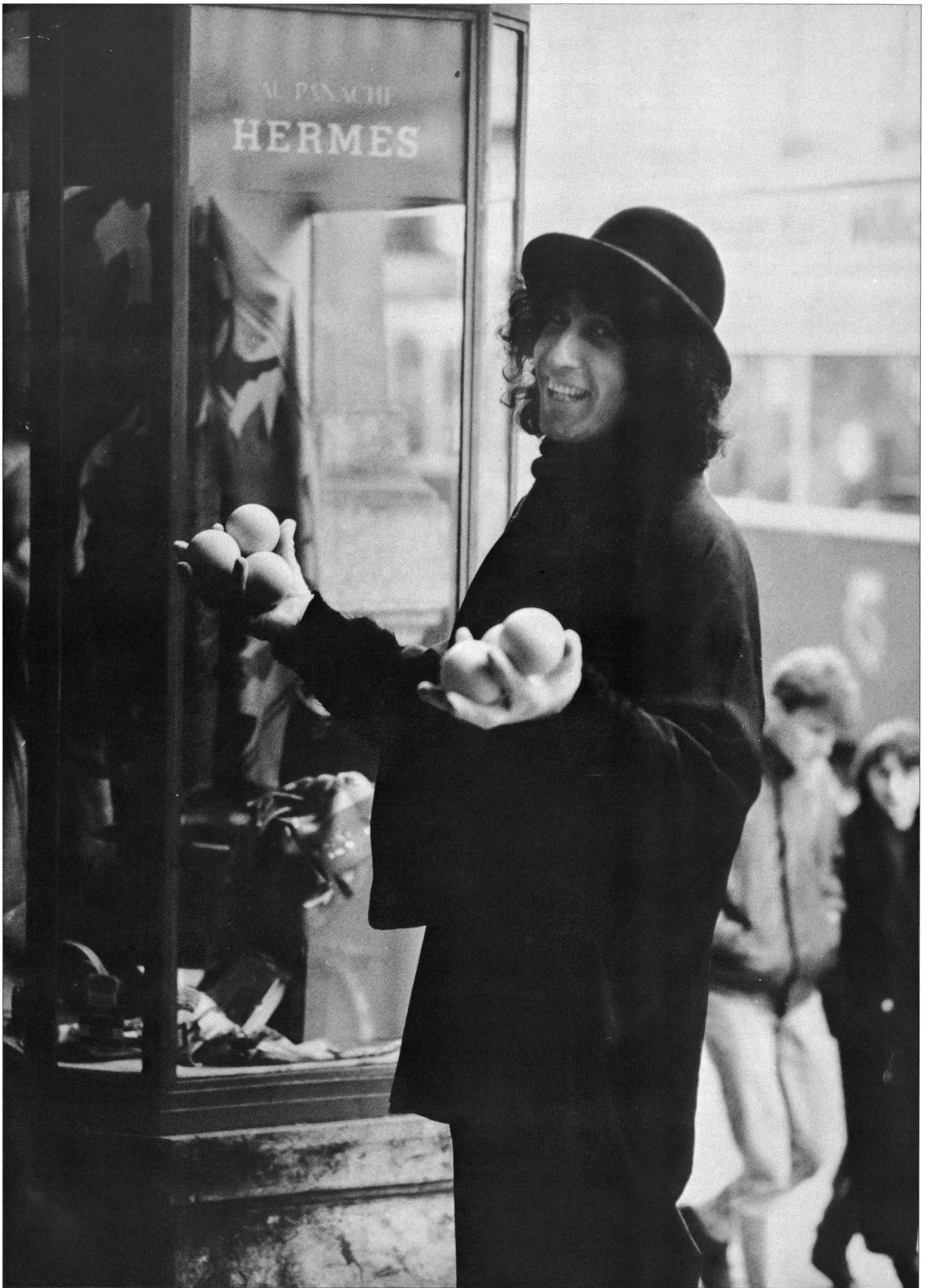
Entrez, entrez m'sieurs dames... (p. 9 à 11).