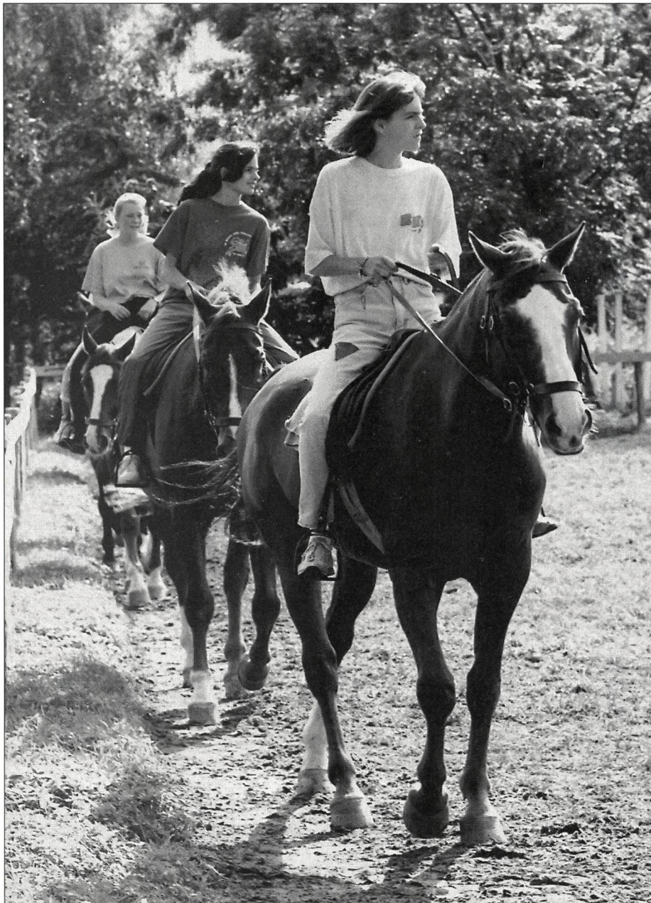
L'équitation: très demandée...

Le rendez-vous donné à la jeunesse du monde (16 à 18 ans) par la Commission «sport» du 700 e anniversaire de la Confédération et ses quatre partenaires: l'Association suisse du sport (ASS), le Comité olympique suisse (COS), la Commission fédérale de sport (CFS) et l'Ecole fédérale de sport de Macolin (EFSM), sous l'égide du Comité international olympique (CIO), a donné lieu à une rencontre réussie et enrichissante.