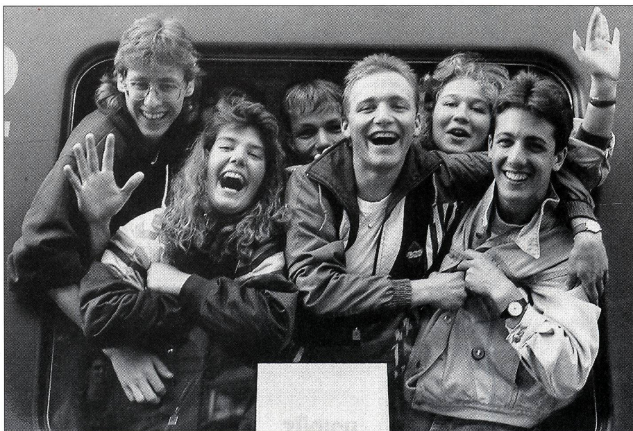
Le cœur plein de souvenirs impérissables.

Un soldat: Si j'avais un enfant, j'aimerais qu'il soit à Tenero!... ■