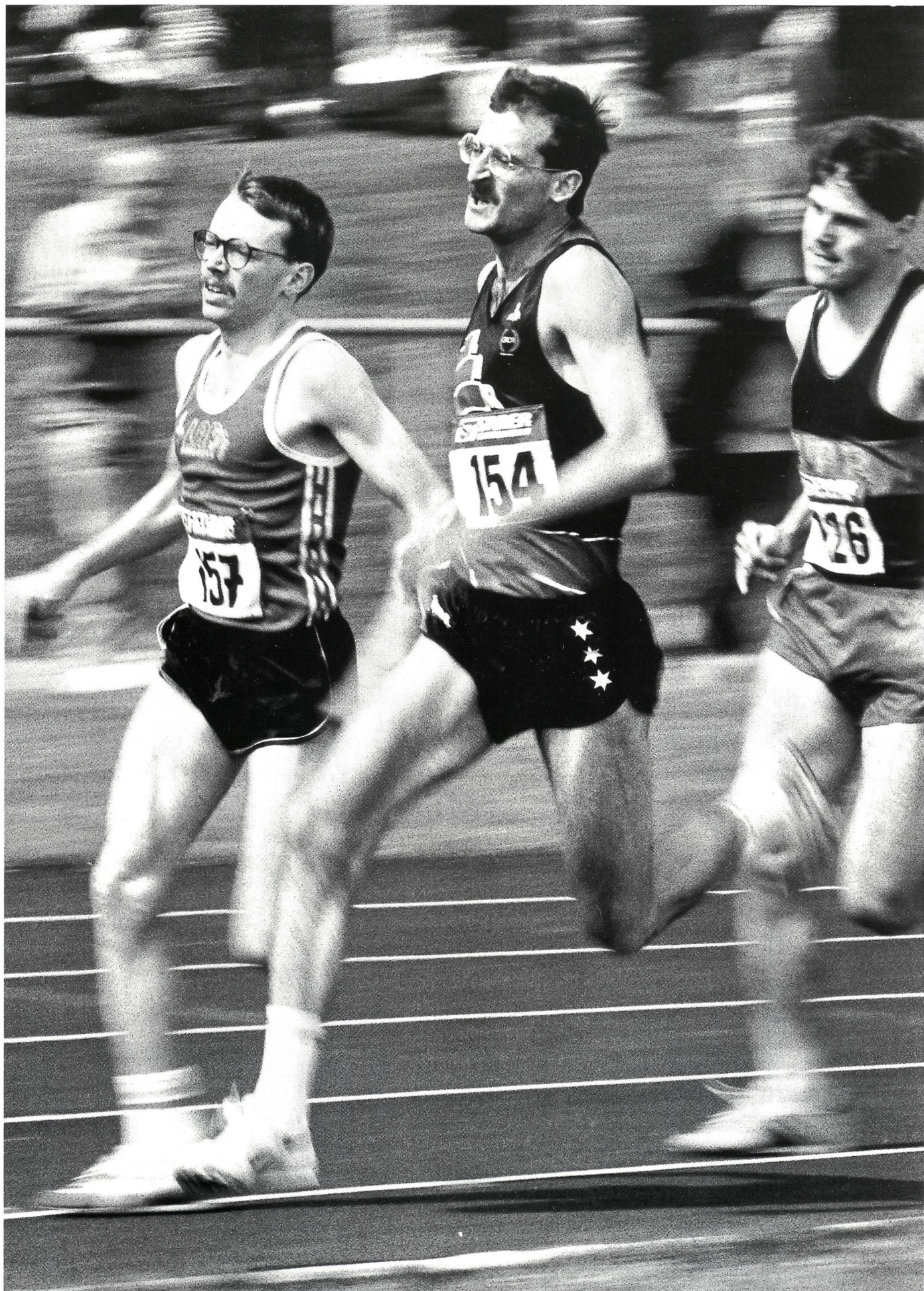
De la difficulté d'être champion (voir aussi l'éditorial, p. 1)