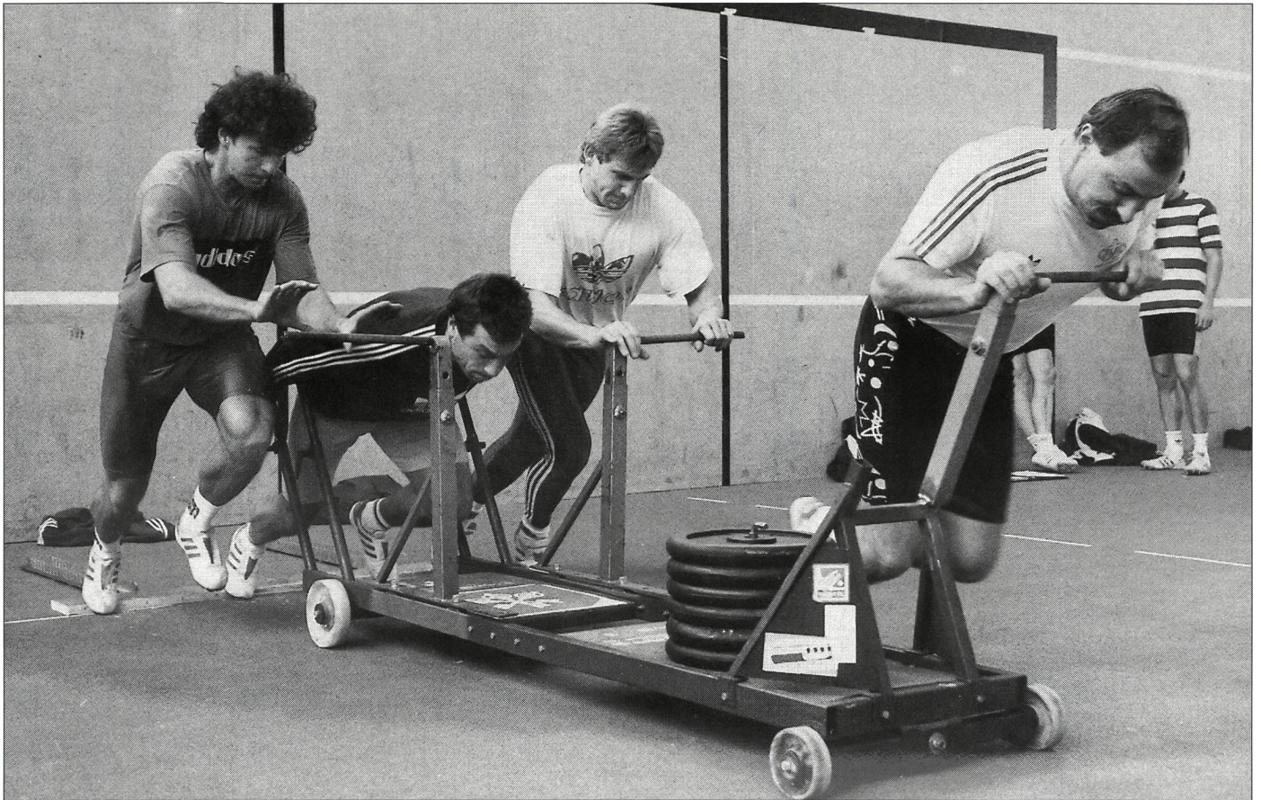
Tout au sommet de la hiérarchie mondiale en bob à 4, l'équipe Weder s'est préparée «à sec», comme d'habitude, à Macolin.