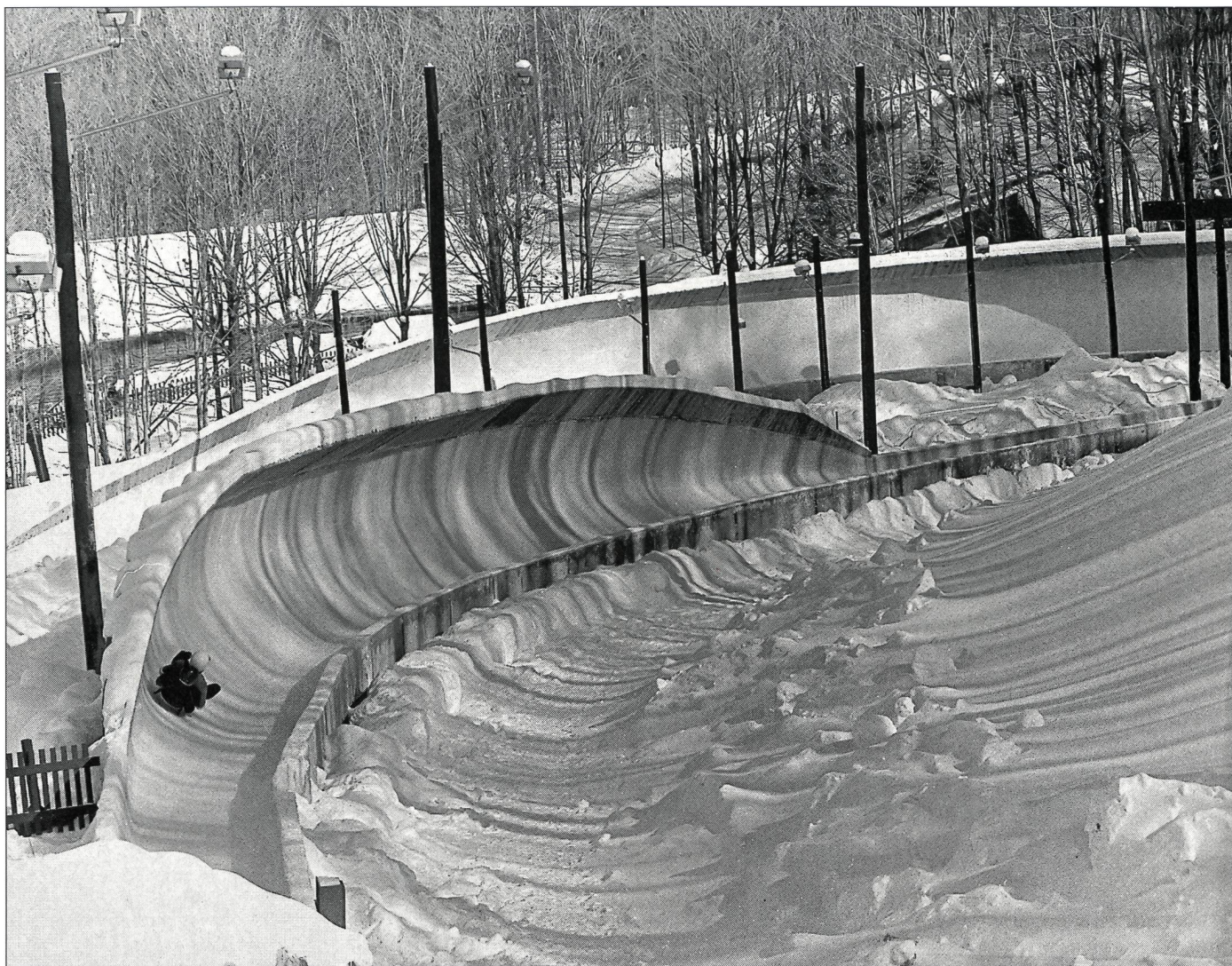
La luge, sport olympique: ici à Lake Placid, en 1980.