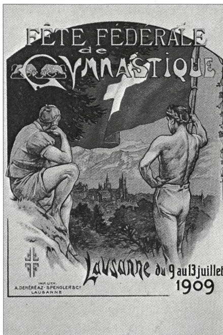
La Fête fédérale de gymnastique, berceau des Jeux nationaux!

Quant à la lutte suisse, elle n'est connue que dans notre pays ou dans les sociétés suisses de l'étranger. Elle se distingue de la lutte libre par le fait que