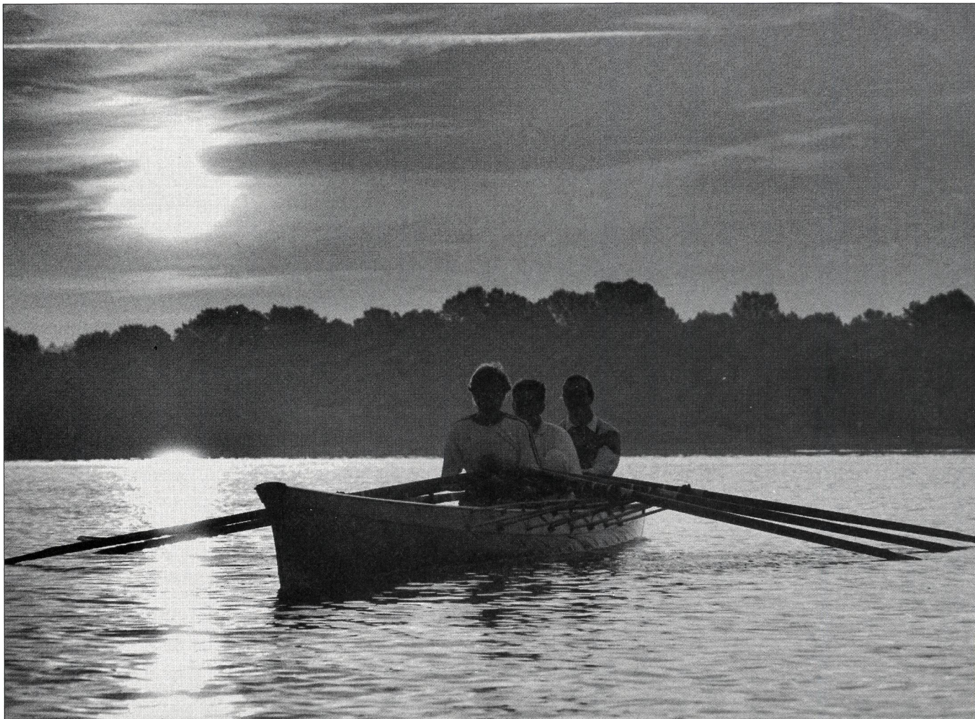
Lumière tamisée d'un petit matin automnal.