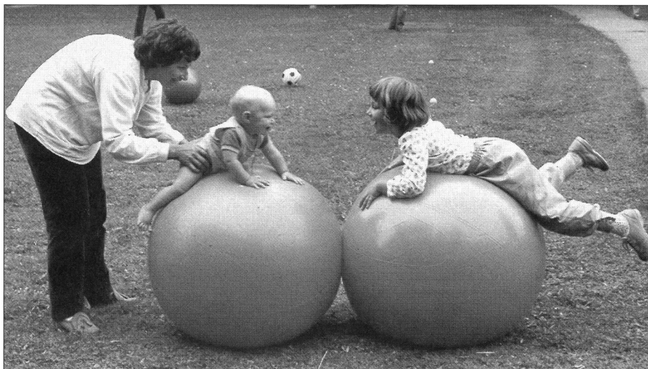
Le passage d'une génération à l'autre.

compagnait les parcours des skieurs iraniens ou libanais lors des derniers jeux olympiques. On leur reprochait d'avoir l'audace de prendre part à un concours dont ils risquaient de fausser les résultats en endommageant les pistes mises à leur disposition. Et cette colère avait quelques motifs. On ne pouvait se permettre de courir le moindre risque dans une compétition qui exigeait tant d'argent pour son organisation!