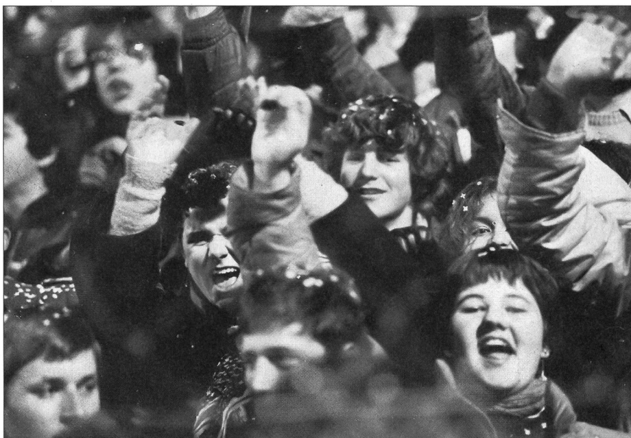
Une jeunesse qui veut se faire entendre.

On sait en fait depuis Jean-Jacques Rousseau que la jeunesse n'est pas une maladie momentanée, que l'enfant n'est pas la copie réduite de l'adulte qu'il souhaiterait devenir, mais qu'à tout moment de son développement, l'être humain est parfaitement cohérent, fait