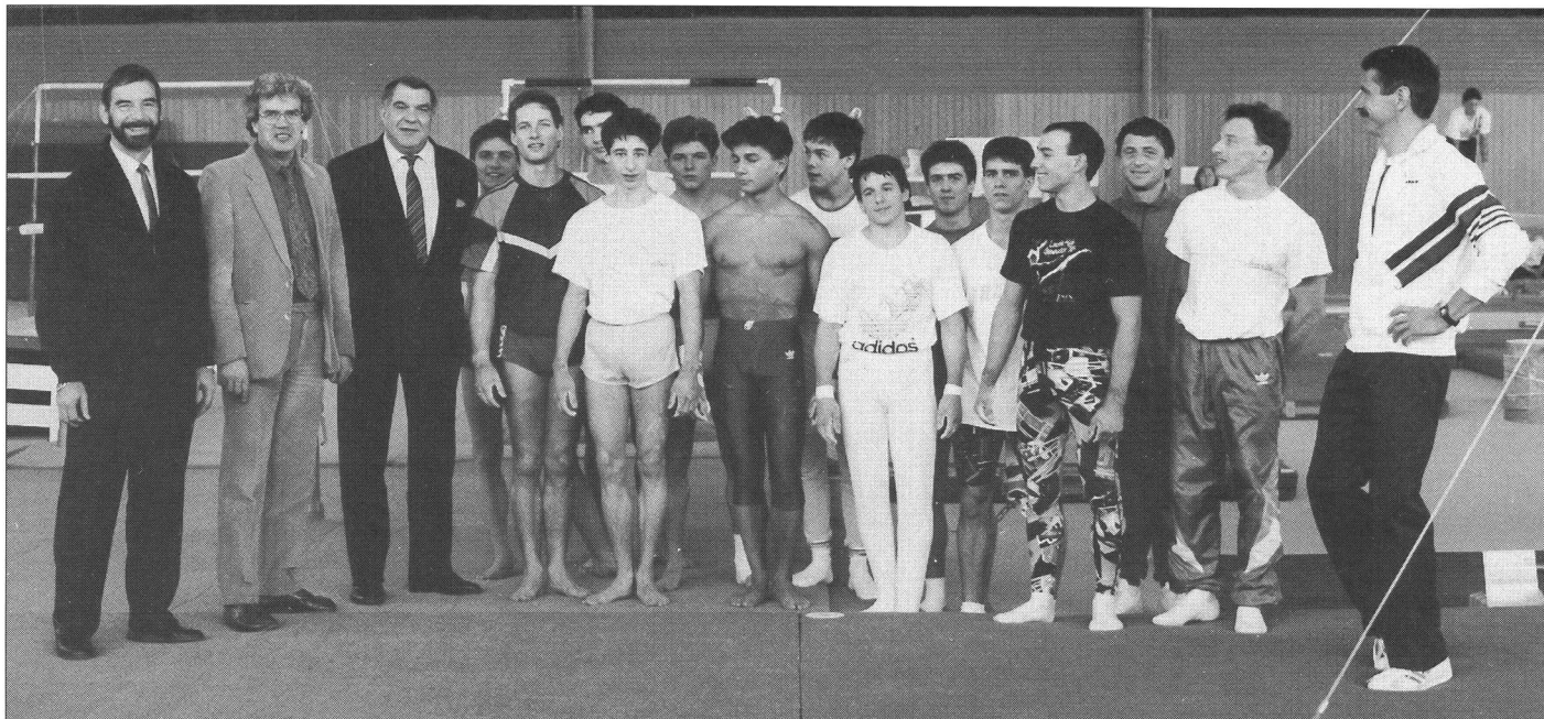
Nos hôtes à la salle du Jubilé avec le cadre des gymnastes de l'équipe nationale et ses entraîneurs. ■