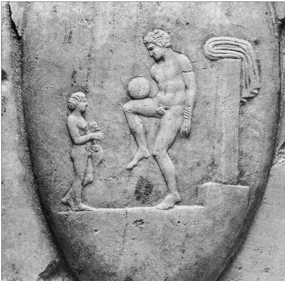
Cette stèle funéraire en marbre représente le premier joueur de football de l'histoire du sport, dit-on (I er siècle avant J.-C.). Elle fait partie de l'exposition «Le Corps et l'Esprit» présentée par la Fondation de L'Hermitage à Lausanne (voir ci-contre).

Rien n'y fit: on jouait toujours et de plus en plus violemment. Dans le «Roi Lear», Shakespeare qualifie un de ses personnages de vil joueur de ballon , ce qui veut tout dire. La violence était telle qu'on pria dans les églises: ... Seigneur, éloignez de nous ce jeu. Qui est