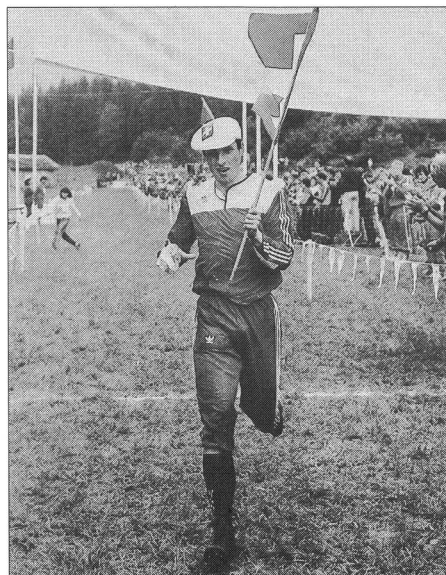
Tiré du «prix du mois».