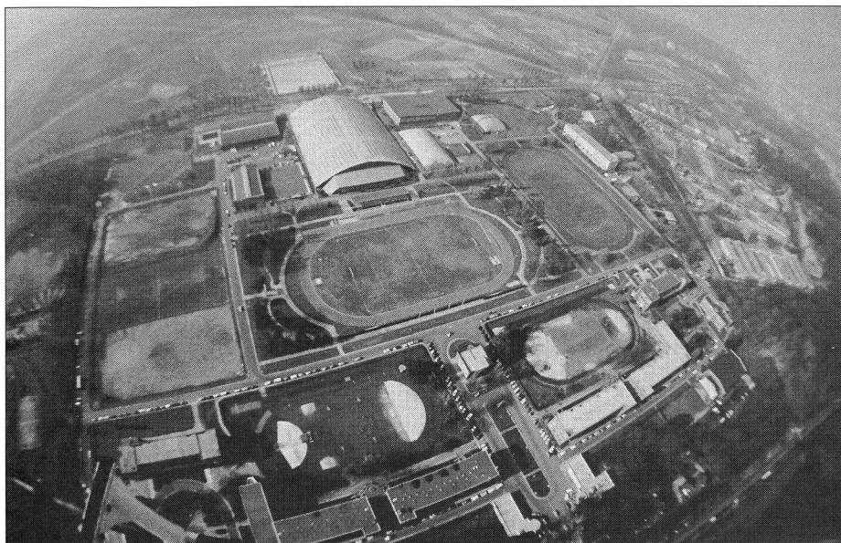
Vue plongeante sur les installations de l'INSEP.