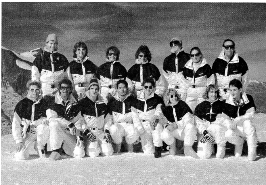
ASSA: guides et handicapés de la vue lors d'un entraînement à Saas-Fee (début octobre 1989).

Voici comment on peut reconnaître les tandems sur les pistes de ski: les membres du groupe de compétition portent une combinaison jaune pour le bas de l'habit et bleue pour le haut; les tandems qui ne font pas partie de l'ASSA sont facilement repérables, puisqu'ils ne sont pas vêtus de la veste jaune à ligne noire caractéristique des membres, ni les guides de la veste rouge à ligne noire. ■