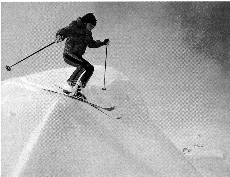
Ski hors piste: la plus grande prudence est de mise, car il faut peu de chose pour déclencher l'avalanche.

Ce document présente les systèmes de secours immédiats et différés, leur fonctionnement, leurs avantages et leurs inconvénients. Des conseils destinés aux utilisateurs (qui peut procéder aux recherches, qui est susceptible d'être recherché?) le complètent et font que sa lecture est vivement conseillée à tous les enseignants conscients de leurs responsabilités. ■