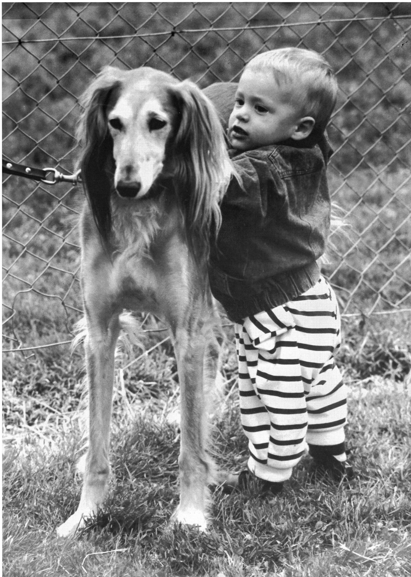
Bons camarades (Saluki, lévrier oriental).