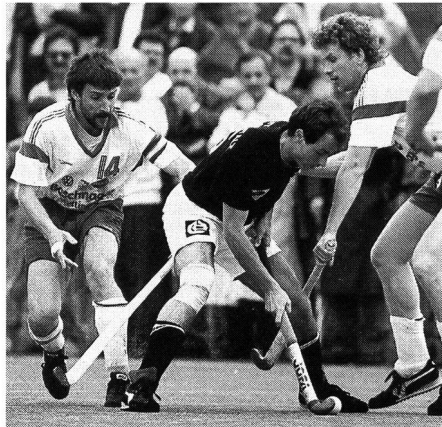
A bon terrain, bonne technique.

nifestations internationales. En décidant, en 1974, d'autoriser l'usage du gazon synthétique pour lesdites rencontres, la FIH a posé un jalon décisif pour l'évolution rapide qu'a connue le hockey sur terre durant ces dernières années. Depuis le «baptême du feu» (Jeux olympiques de Montréal, en 1976) la tendance en faveur du gazon synthétique s'est définitivement confirmée.