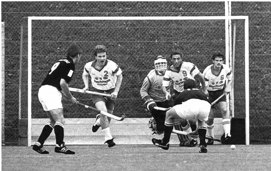
Corner court: technique et tactique à adapter.

accidents ou inégalités de terrain (gazon de longueurs différentes) n'existent plus. De même, les techniques étant simplifiées, il n'est plus guère possible de spéculer sur le hasard d'une balle non stoppée par l'adversaire;