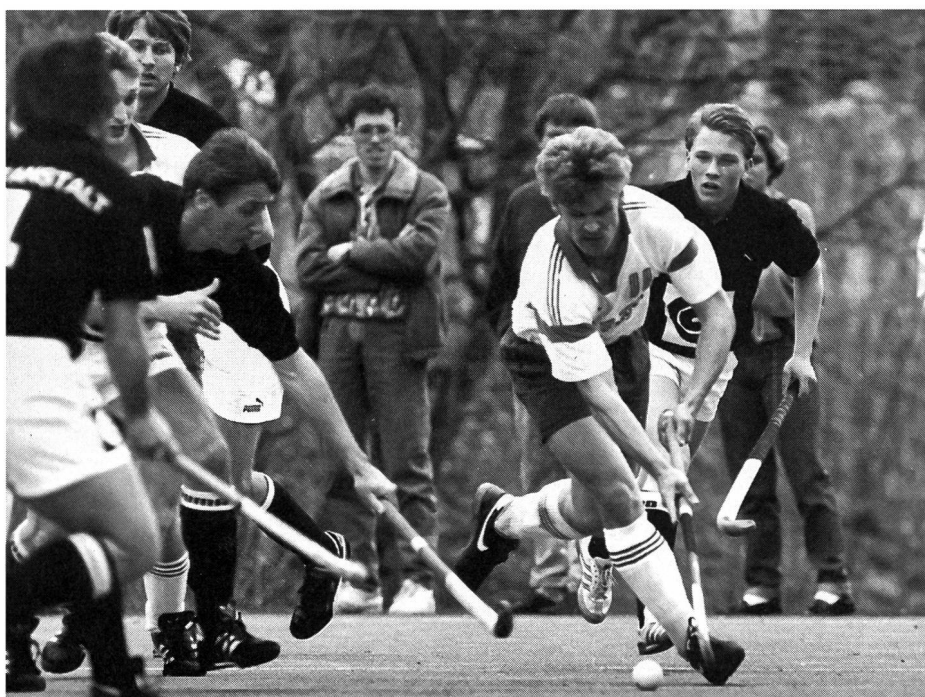
Revers opposé à un dégagement feinté.

De par la nature même du revêtement, on en est forcément arrivé, ces dernières années, à mettre au point toute une gamme de nouvelles techniques et de variantes. La pratique sur gazon synthétique a emprunté certains éléments au hockey en salle. Le lecteur trouvera ci-après, en résumé, la liste des principaux changements et innovations en matière de technique de base: