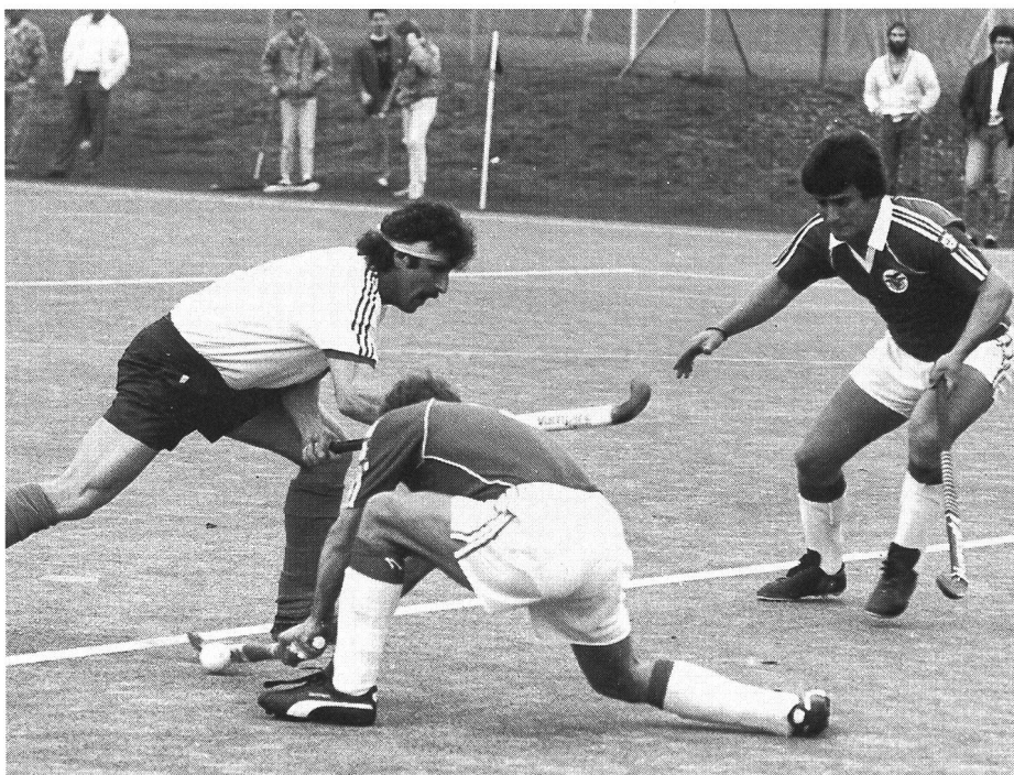
Contrôle par pose de la canne entière sur le sol.

Le recours au gazon synthétique est devenu vital pour le développement ultérieur du hockey sur terre. Les responsables suisses s'étant engagés dans cette voie, ils doivent désormais continuer à la suivre. Il ne faut pas, pour autant, qu'ils perdent les inconvénients de vue. Les milieux de l'industrie et de la recherche sont donc mis en demeure de rattraper, dans les meilleurs délais, le retard subi en raison du développement foudroyant du hockey sur gazon synthétique. On devrait en effet éviter que la technique du hockey sur terre continue de prendre le pas sur la technologie du gazon synthétique en tant que produit. ■