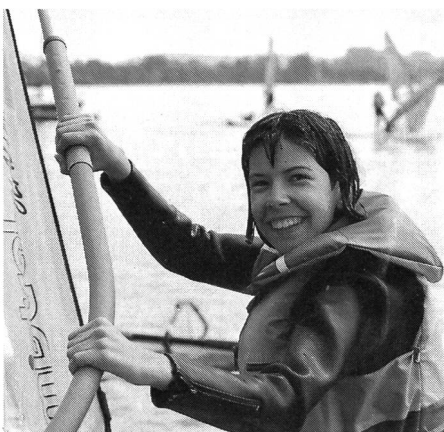
Sourire et gilet de sauvetage.

Par une organisation judicieuse de l'enseignement, par un équipement et un comportement adaptés à la situation, il s'agit d'apprendre aux participants à faire face aux dangers qui peuvent se présenter sur l'eau.