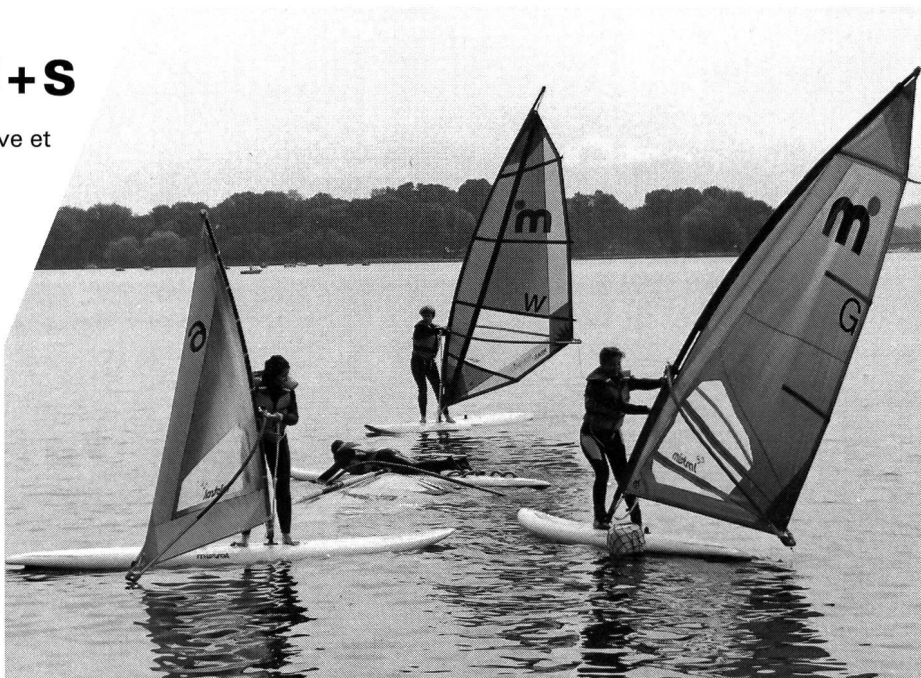
Débutants en cours d'apprentissage.

En tant que chef de cette nouvelle branche sportive, j'espère qu'on y at-