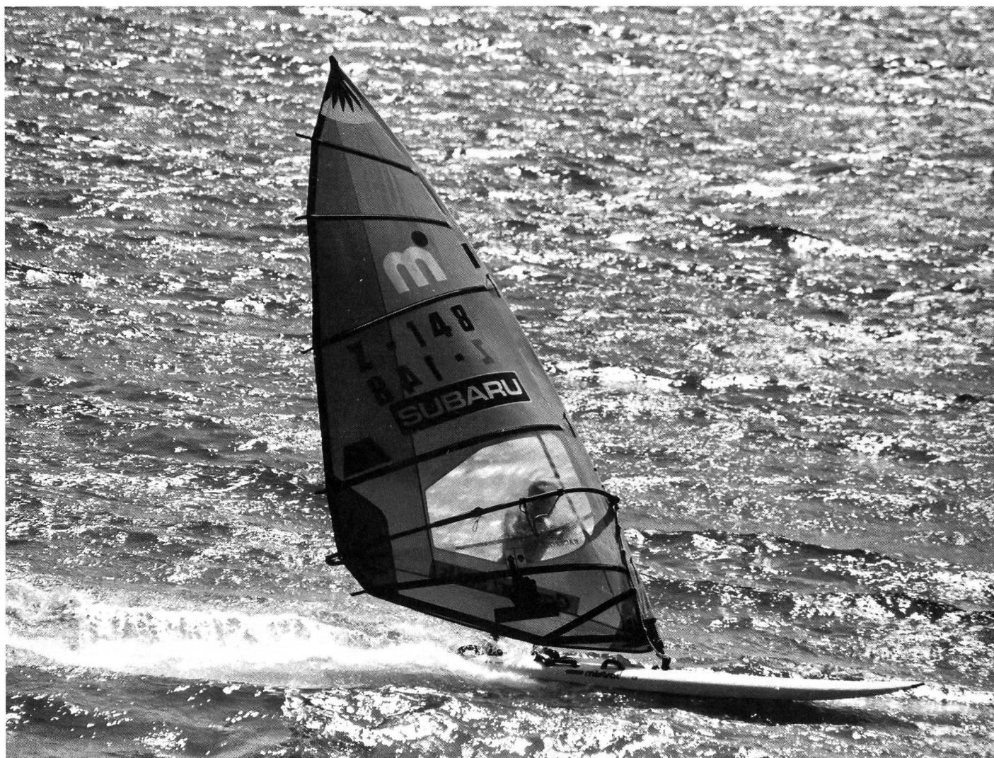
La compétition (ici la «Jet Set Cup», Silvaplana): grisurie de la vitesse au bout de l'apprentissage.

Les clubs de planche à voile peuvent apporter une autre solution au problème du matériel. Relevons enfin que le Centre sportif de Tenero offre d'excellentes conditions pour la réalisation des cours qui s'adressent aux débutants (matériel à disposition). ■