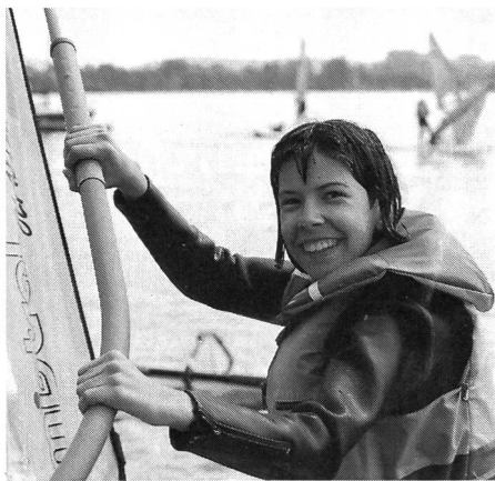
Sourire et gilet de sauvetage.

Par une organisation judicieuse de l'enseignement, par un équipement et un comportement adaptés à la situation, il s'agit d'apprendre aux participants à faire face aux dangers qui peuvent se présenter sur l'eau.