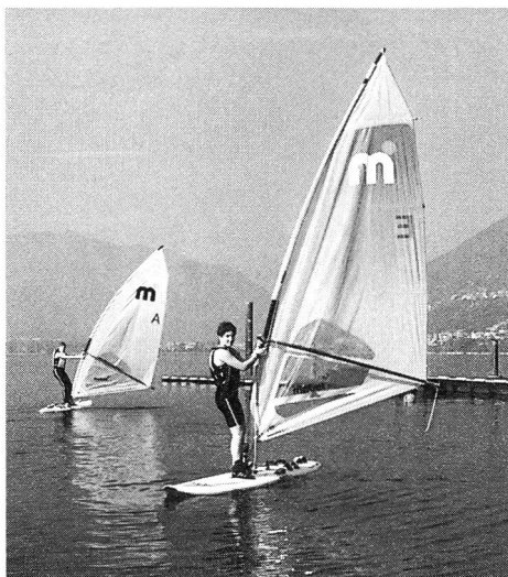
Rotation de 180° et départ.

n'était pas insurmontable et qu'elle n'arrivait pas à séparer les jeunes, mais que chacun devait y mettre du sien pour qu'il en soit ainsi.