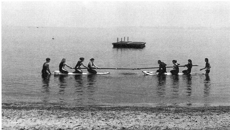
Jeux avec flotteurs et mâts...

L'après-midi était réservée aux Olympiades de Tenero, auxquelles ont parti-