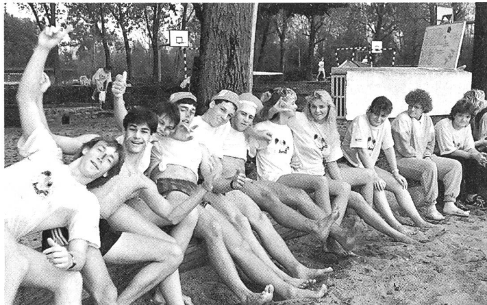
... ambiance détendue.