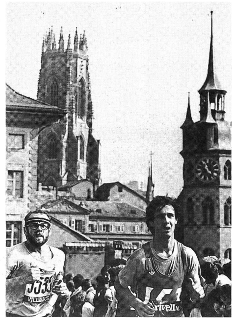
Extrait du livre Morat-Fribourg.

Comme chaque année, ce numéro d'octobre de MACOLIN sort alors que vient de se disputer la fameuse course