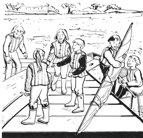
Extrait du prix du mois.

Ils permettent : — le changement d'équipage en cours de séance ; — le regroupement des enfants pour donner des consignes sans retour à terre. Ils jouent le rôle de « point repérable » sur le plan d'eau. Ils existent dans le circuit commercial mais ils peuvent être fabriqués à partir de barils métalliques rendus solidaires et supportant un plancher.