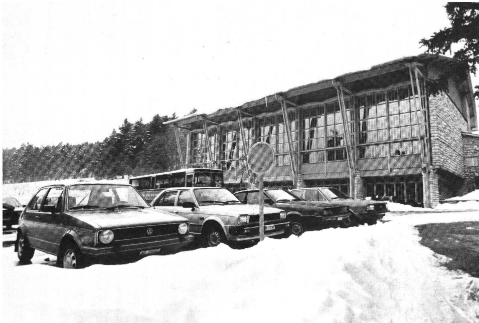
Quand on vient de loin, l'emploi d'un véhicule motorisé peut se justifier pour accéder à la salle de sport.