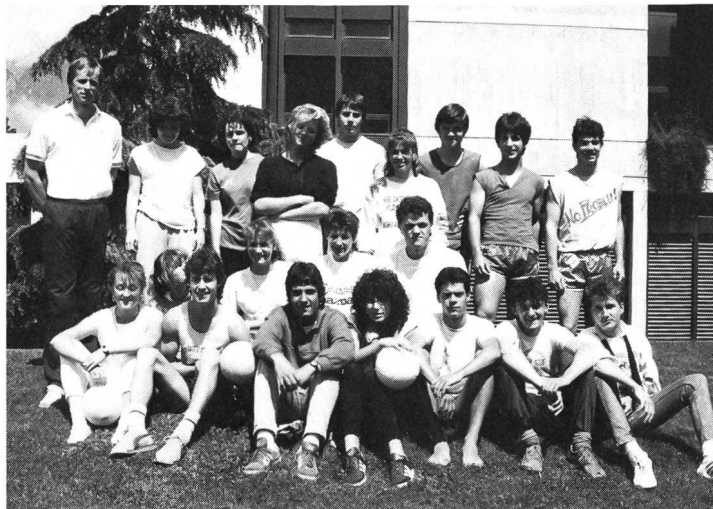
...et la classe d'artistes et de sportifs.

– il promet, de par ses résultats et ses prédispositions, de pouvoir faire carrière dans le domaine sportif ou artistique.