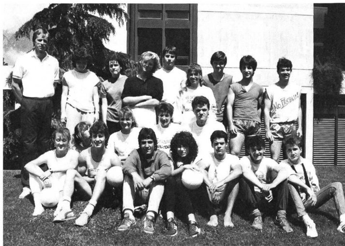
...et la classe d'artistes et de sportifs.

— il promet, de par ses résultats et ses prédispositions, de pouvoir faire carrière dans le domaine sportif ou artistique.