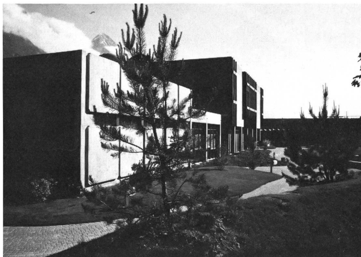
L'Ecole supérieure de commerce de Martigny...